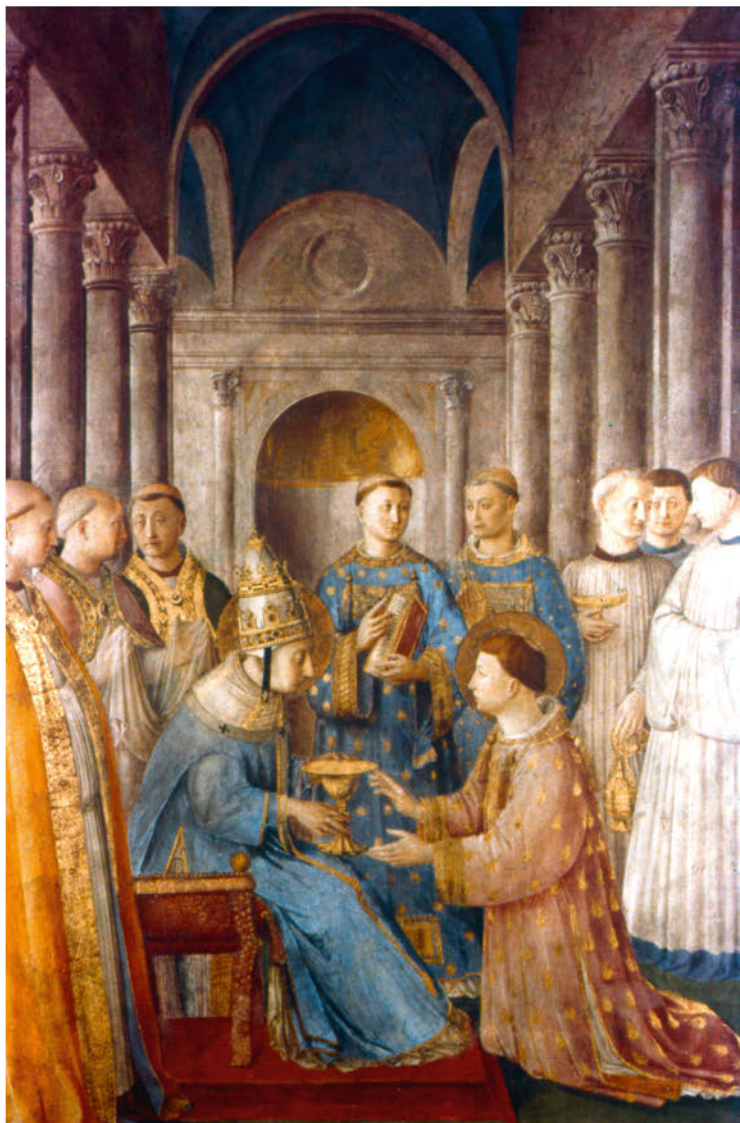
Фра Анджелико. Посвящение святого Лаврентия в сан дьякона, 1447–1451 Фреска, 271 × 197 см Капелла Никколина, Ватикан

На предыдущей странице: Беноццо Гоццоли. Шествие волхвов: Лоренцо Великолепный, 1459–1462 Фреска Палаццо Медичи-Риккарди, Флоренция