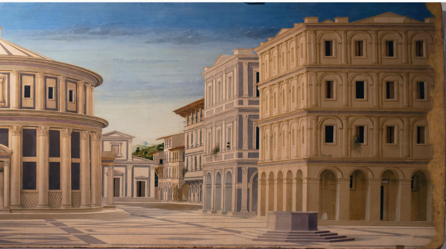
«Идеальный город» Лучано де Лаурана (приписывается), 1480–1490 Холст, масло, 67,7 × 239,4 см Национальная галерея Марке, Урбино

Вазари во втором издании своих знаменитых «Жизнеописаний», вышедшем в 1568 году. Этим термином он обозначил мировоззрение, уже сложившееся в предыдущем столетии и укрепившееся в течение XVI века. В своем труде Вазари яростно критикует «манеру, изобретенную готами после того, как они разрушили древние постройки», «эти работы, которые именуются немецкими [...] лучшими мастерами избегаются как уродливые и варварские, ибо в них отсутствует порядок...» 2 — отныне «Ренессанс» будет противопоставляться «Средневековью».