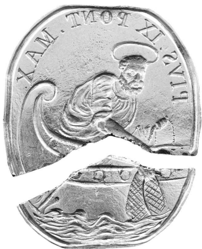
Золотое кольцо рыбака, принадлежавшее папе Римскому Пию IX и сломанное после его смерти

Итак, первые необходимые церемонии были проведены. Курия начинала готовиться к следующему важнейшему этапу — похоронам римского папы. Разумеется, лицо такого уровня не могло быть погребено тихо и скромно. Последнее появление епископа-монарха перед верующими должно не уступать в торжественности и пышности его коронации. Скончался не просто глава государства,