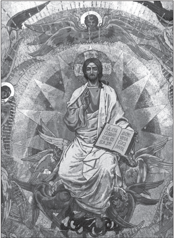
Христос во славе. Мозаика. Санкт-Петербург. Храм Спаса-на-Крови