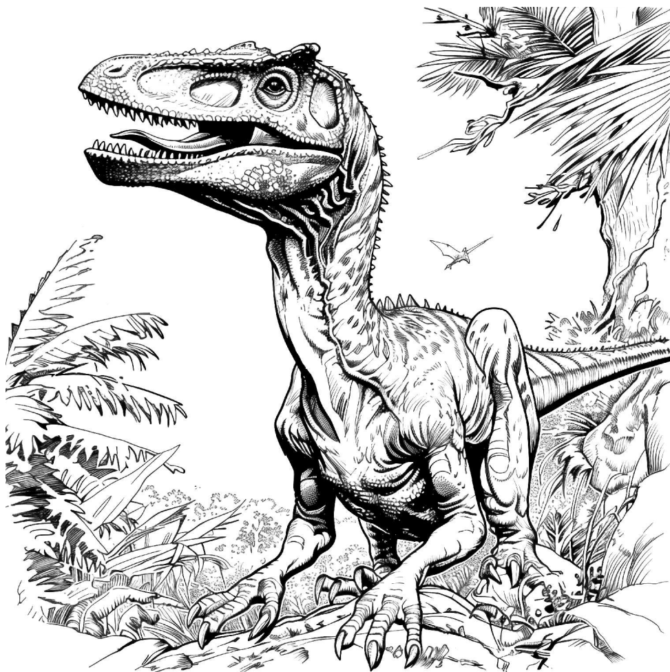
АЛЬБЕРТОЗАВР (лат. Albertosaurus)