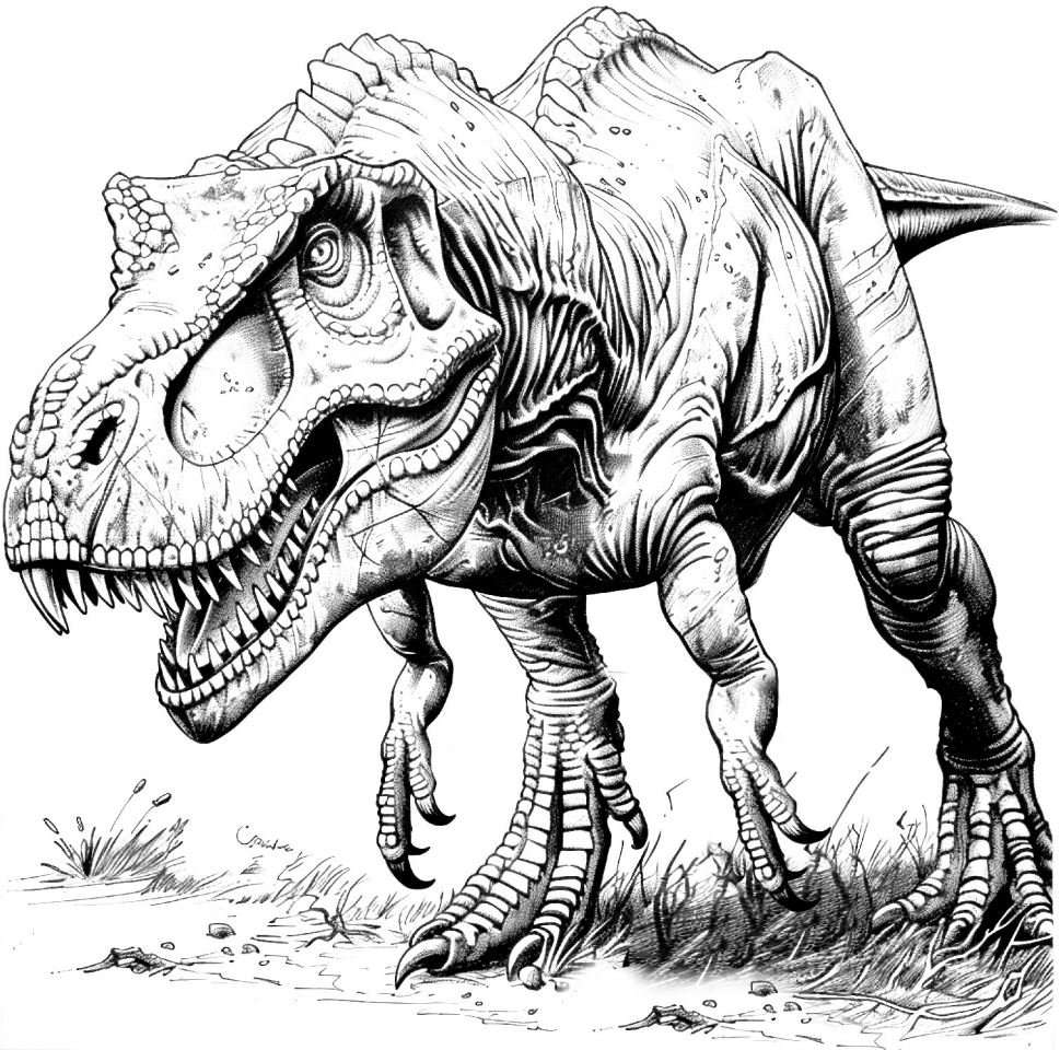
АКРОКАНТОЗАВР (лат. Acrocanthosaurus)