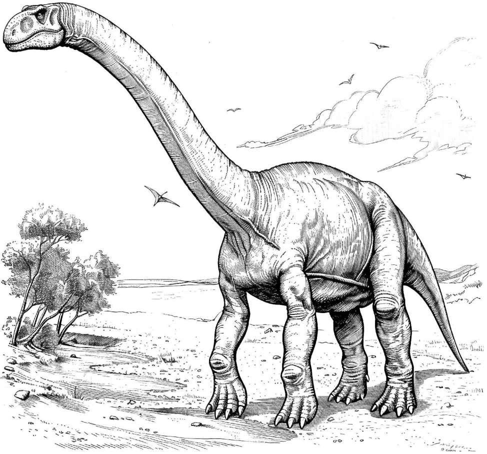
АРГЕНТИНОЗАВР (лат. Argentinosaurus)