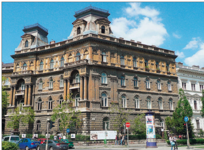
■ На улицах города

стерегут грозные каменные львы, поднимемся к мощным стенам Цитадели на самой вершине горы Геллерт, выпьем чашечку кофе в арках Рыбацкого бастиона, сделаем знаменитое фото отражения церкви Матьяша в евrostеклах пафосного отеля «Хилтон», исследуем на арендованном двухколесном друге утопающий в цветах остров Маргит с развалинами старинного монастыря, побываем в самых настоящих пещерах с причудливыми фигурами из сталактитов, прокатимся на самом старом метро Европейского континента и в миниатюрном вагончике пионерской железной дороги.