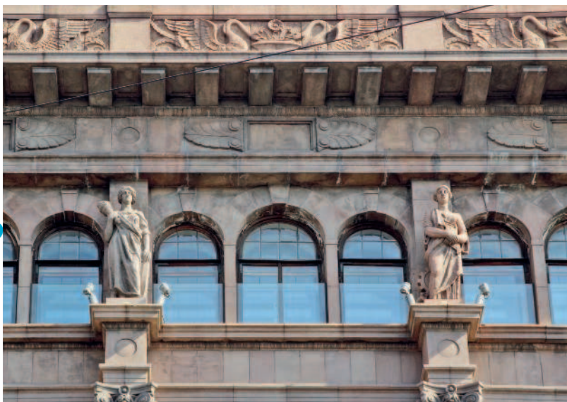
Фасад дома № 12 украшен скульптурами и барельефами