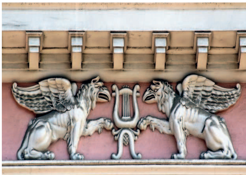
Дом № 8 украшают изображения грифонов

и на этом месте по проекту архитектора М. М. Перетятковича построил здание Санкт-Петербургского торгового банка, которое получило имя дом Вавельберга. Сам банк размещался на нижнем этаже, а верхние этажи были жилыми.