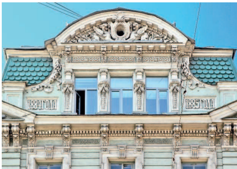
Примечательный фронтон дома № 5

мерческого акционерного банка. Здание облицевали светло-серым гранитом, темно-красным гнейсом и желтовато-серым песчаником, что придало ему парадный вид. В списке дирекции банка был промышленник К. Ф. Сименс. Учреждение действовало до 1917 года. В советский период в здании размещалось издательство «Прибой», литобъединение «Смена», Ленинградское отделение Российского телеграфного агентства и др.