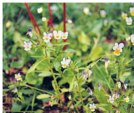
ФИАЛКА ПОЛЕВАЯ Viola arvensis Misr.