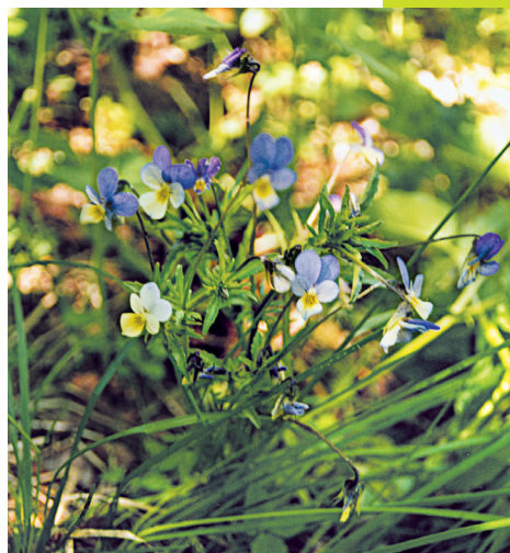
ФИАЛКА ТРЕХЦВЕТНАЯ Viola tricolor L.

Измельченную траву принимают в виде напара из 2 ст. ложек сырья на 1 стакан воды. В день следует принимать не более 1 стакана этого напара, т.к. большие дозы могут вызвать рвоту и раздражение кишечника. Напаром фиалки лечат бронхиты, подагру и артриты, суставный ревматизм. Благодаря наличию в траве фиалки такого вещества, как кверцетин, препараты на ее основе уменьшают проницаемость сосудистой стенки, что, в свою очередь, снимает зуд кожи и улучшает общее состояние больного как при приеме их внутрь, так и при наружном использовании в виде ванн и примочек. Чай из фиалки обладает мочегонным, потогонным и кровоочистительным действием, а также применяется для лечения многих кожных болезней: золотухи, экземы, нейродермита. Грудных детей при потнице и раздражении кожи купают в ванне с отваром травы фиалки и череды (поровну). При экземе и фурункулезе детям внутрь дают чай с травой фиалки в дозе не более 1 ст. ложки в день. Чай из травы фиалки приятно пахнет, но при его употреблении моча приобретает специфический запах. В гомеопатии препарат фиалки используют при лечении кожных и легочных заболеваний.