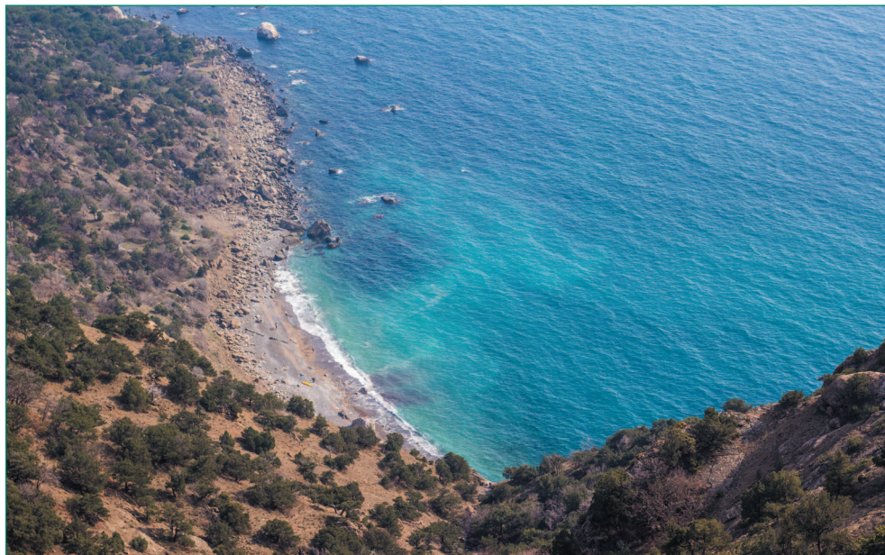
Крым очень любят серферы