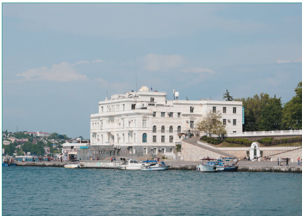
Здание Института биологии южных морей в Севастополе