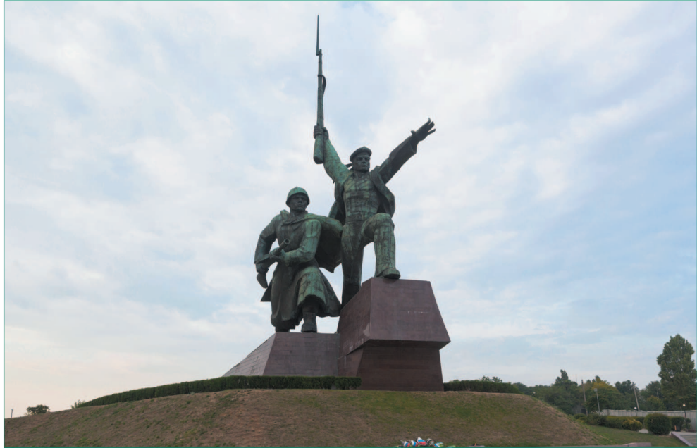
Памятник матросу и солдату в Севастополе