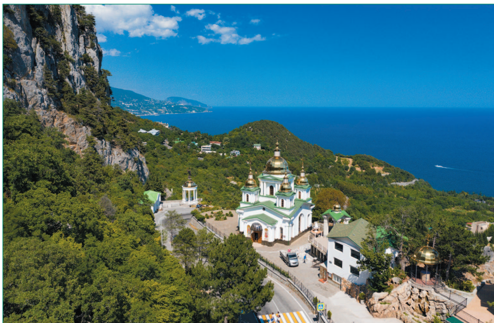
Храм Архангела Михаила в Севастополе

ила, иначе Михайловский собор. О нем следует сказать особо. Возведенный в 1848 году, он на протяжении всего времени своего существования был воинским храмом. Потому и освящен в честь архистратига Михаила — предводителя