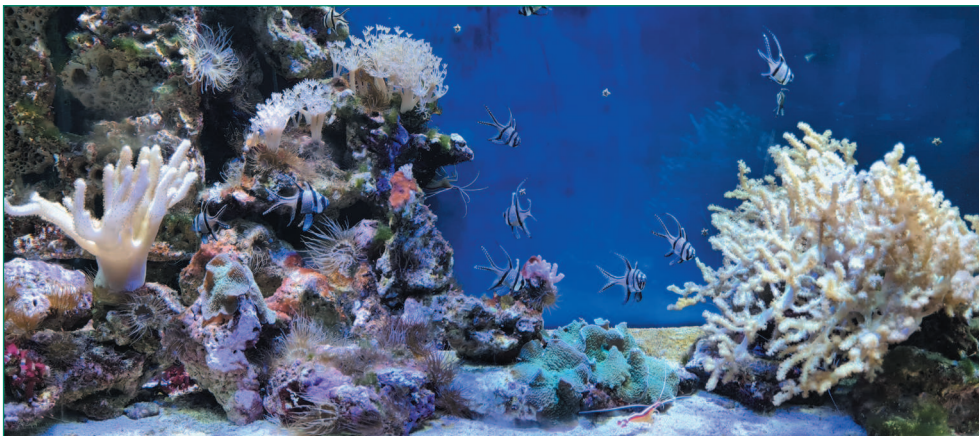
Один из аквариумов Института биологии южных морей

Хорошим продолжением отдыха может стать посещение небольшого частного контактного зоопарка: покормите животных, прокатитесь на коне.