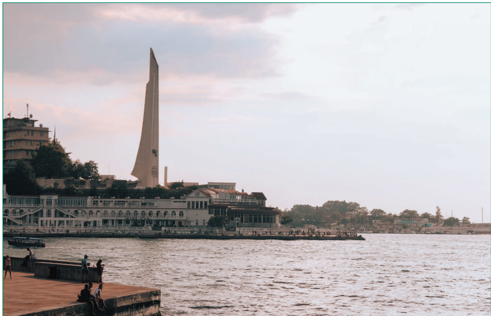
Обелиск городу-герою Севастополю