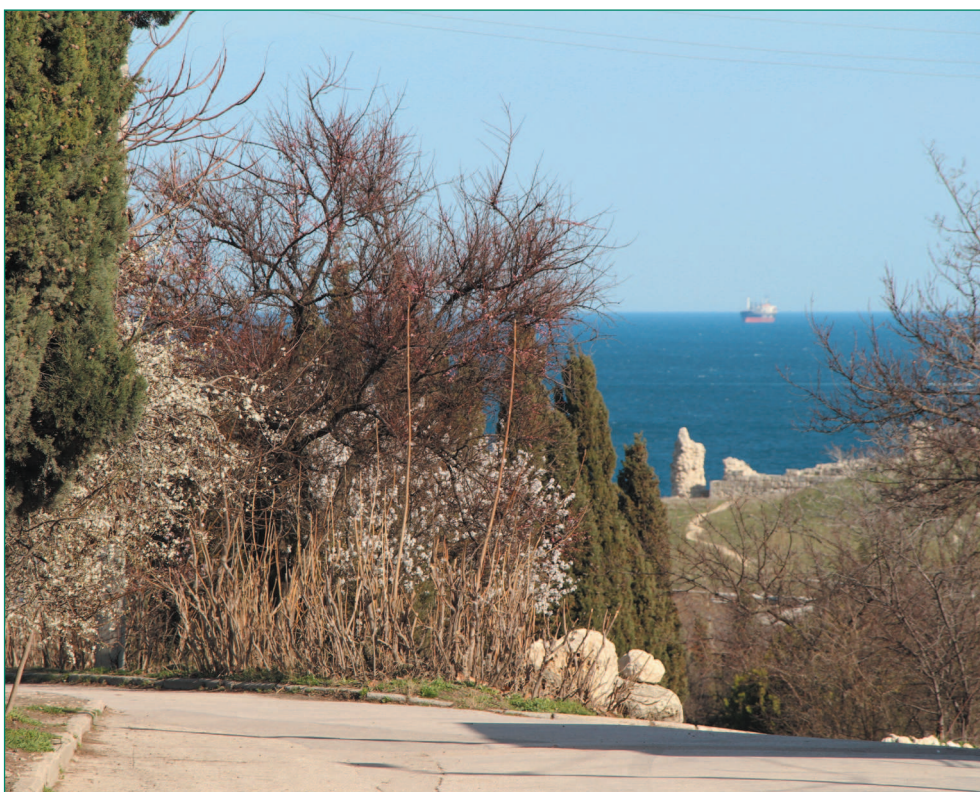
Парк имени Анны Ахматовой в Севастополе