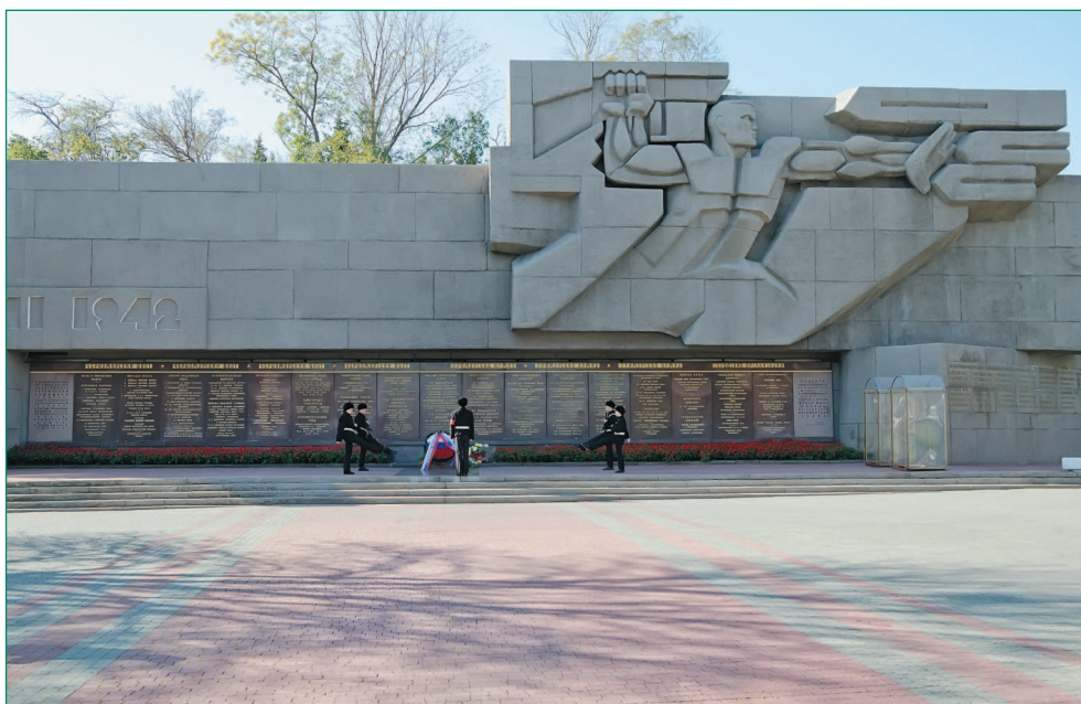
Мемориал героической обороны Севастополя 1941–1942 гг.

На площади Нахимова в 60-е годы прошлого века соорудили грандиозный Мемориал героической обороны Севастополя 1941–1942 годов. Для создания мемориала использовались большие железобетонные и гранитные плиты, подчеркивающие мощь и строгость памятника. Монументален центральный барельеф бойца, в правой руке которого автомат, а левой герой отражает три