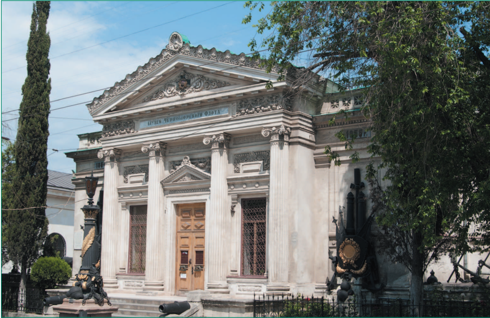
Военно-исторический музей Черноморского флота

уже в 1869 году. Причем место для него было выбрано памятное — дом генерала Тотлебена. С тех пор музей неоднократно расширялся. Ему покровительствовал сначала Александр II, затем Александр III, который повелел выделить участок под строительство специализированного здания в соответствующем его назначению стиле — классическом. Расширялся музей и после революции. И вот наконец в 1940 году состоялось его преобразование в Военно-исторический музей Черноморского флота.