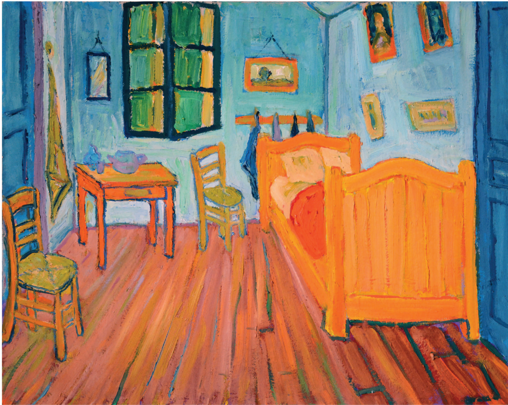
Спальня в Арле, октябрь 1888