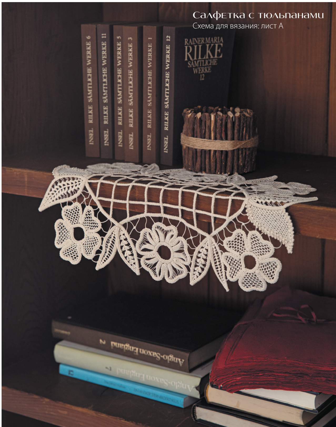
Схема для вязания: лист А