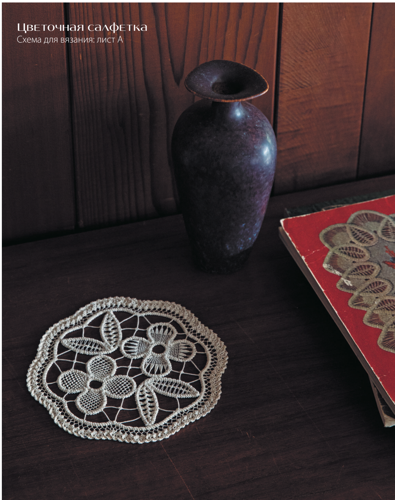
Схема для вязания: лист А