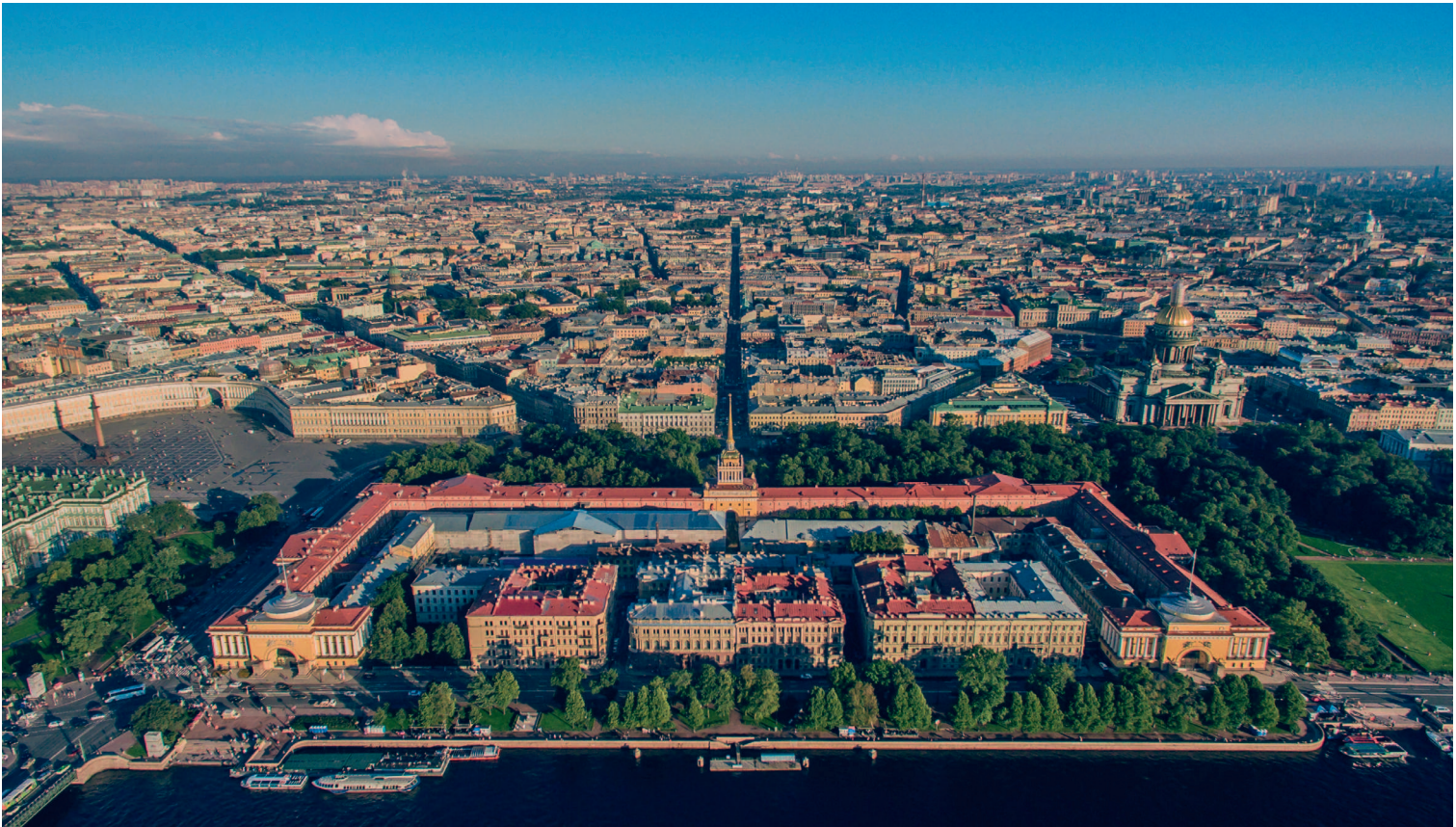
THE ADMIRALTY BUILDING