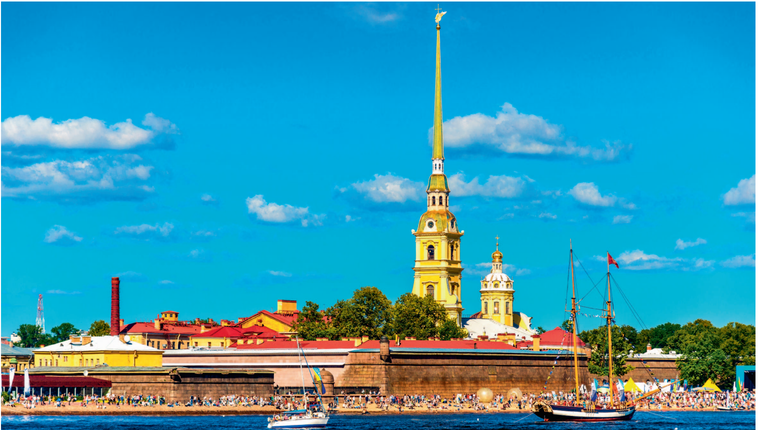
PETER AND PAUL FORTRESS