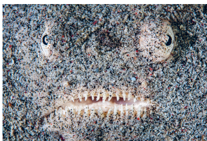
Живой звездочёт ( Uranoscopus sulphureus ) прячется в неживом песке

Короче, вопрос о природе жизни и ее границах — это тот ещё философский (и научный) геморрой. Удивительно, но даже спустя века после возникновения науки о живом это вроде бы базовое для «биологии» (от древнегреческого bios — жизнь и logos — учение) понятие до сих пор так и не имеет общепринятого определения.