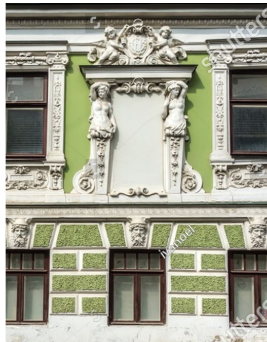
Печатников переулок, 7