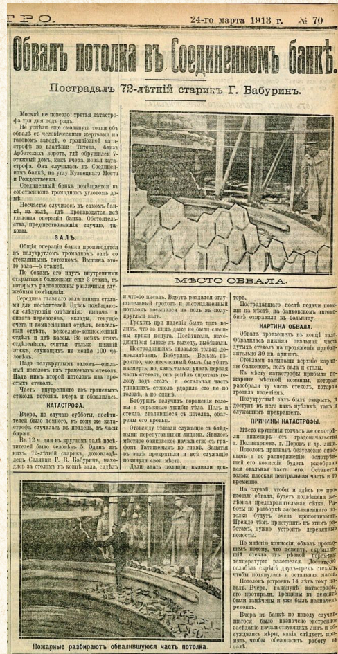
Газета «Утро России», 24 марта 1913 года