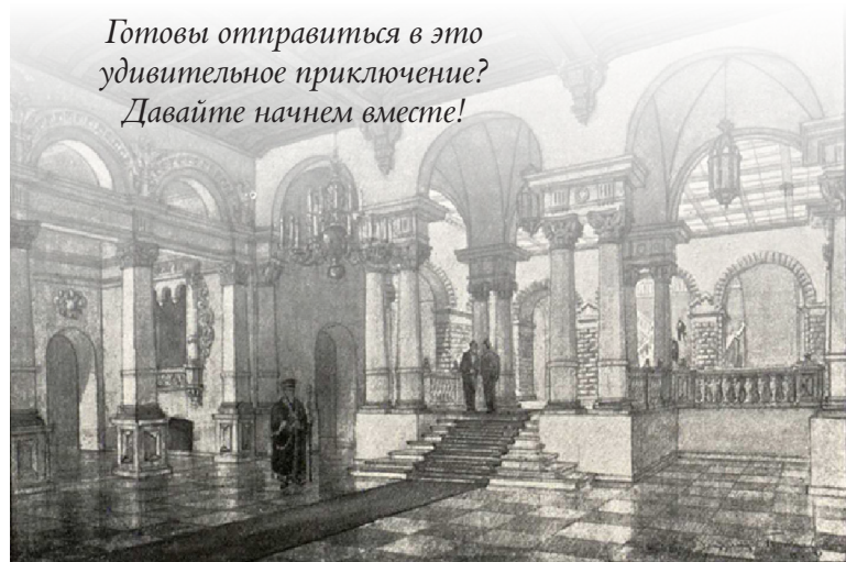
Вестибюль Ссудной казны. Иллюстрация из Ежегодника Императорского Общества архитекторов-художников, 1915 год

Готовы отправиться в это удивительное приключение? Давайте начнем вместе!