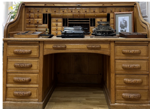
Конторский банковский стол

Интересно, что Антон Павлович Чехов в 1887 году написал рассказ «Лев и Солнце», основанный на реальных событиях. Герой