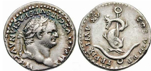
Римская Империя, Тит, 79–81 гг., денарий (реверс: дельфин, извивающийся вокруг якоря)