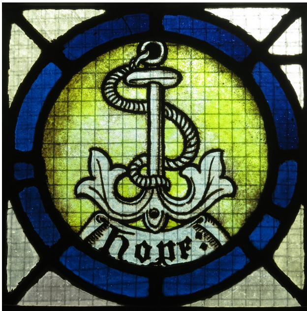
Витражное окно католической церкви Святого Винсента де Поля в Маунт-Вернон, штат Огайо