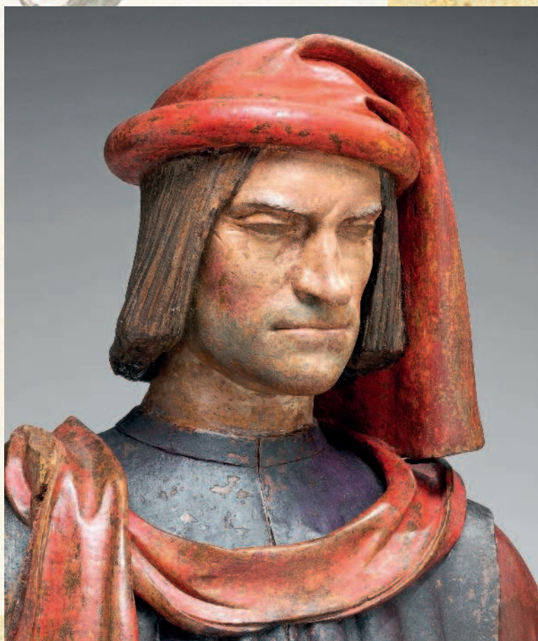
Терракотовый бюст Лоренцо Медичи, выполненный на основе его восковых прижизненных изображений, изготовленных Андреа Верроккьо и Орсино Бенинтенди. XV–XVI век. Национальная галерея искусства, Вашингтон. 65,8 × 59,1 × 32,7

об искусстве, никогда не сходясь во мнениях. Этот начинающий художник получит от Лоренцо единственный заказ, подходящий ему по духу: рисунок повешенного преступ-