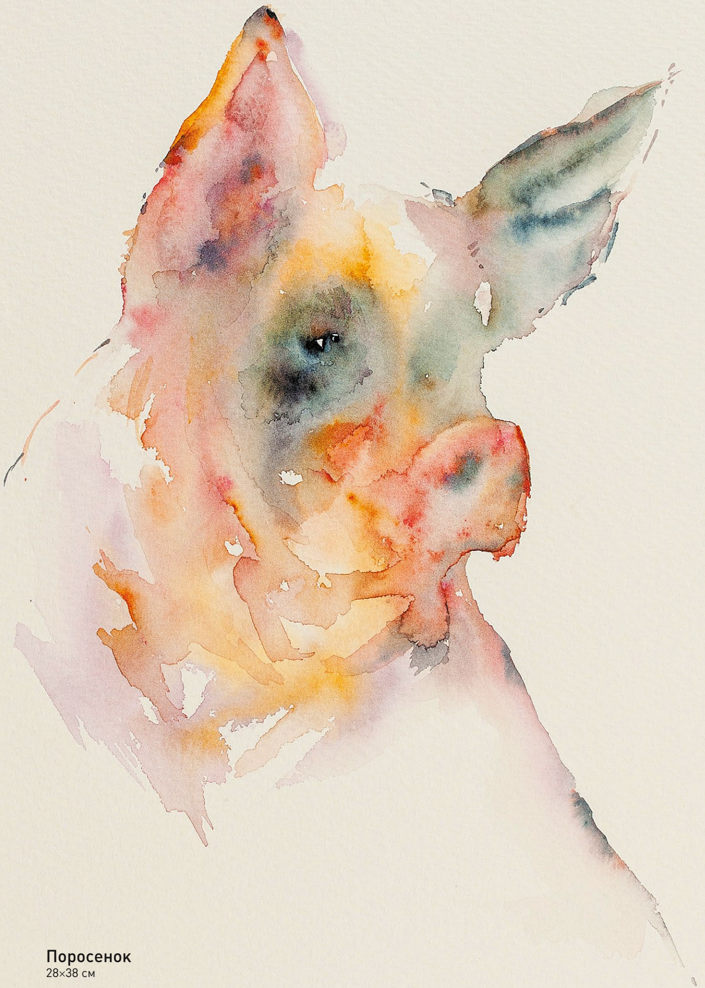
Поросенок 28×38 см