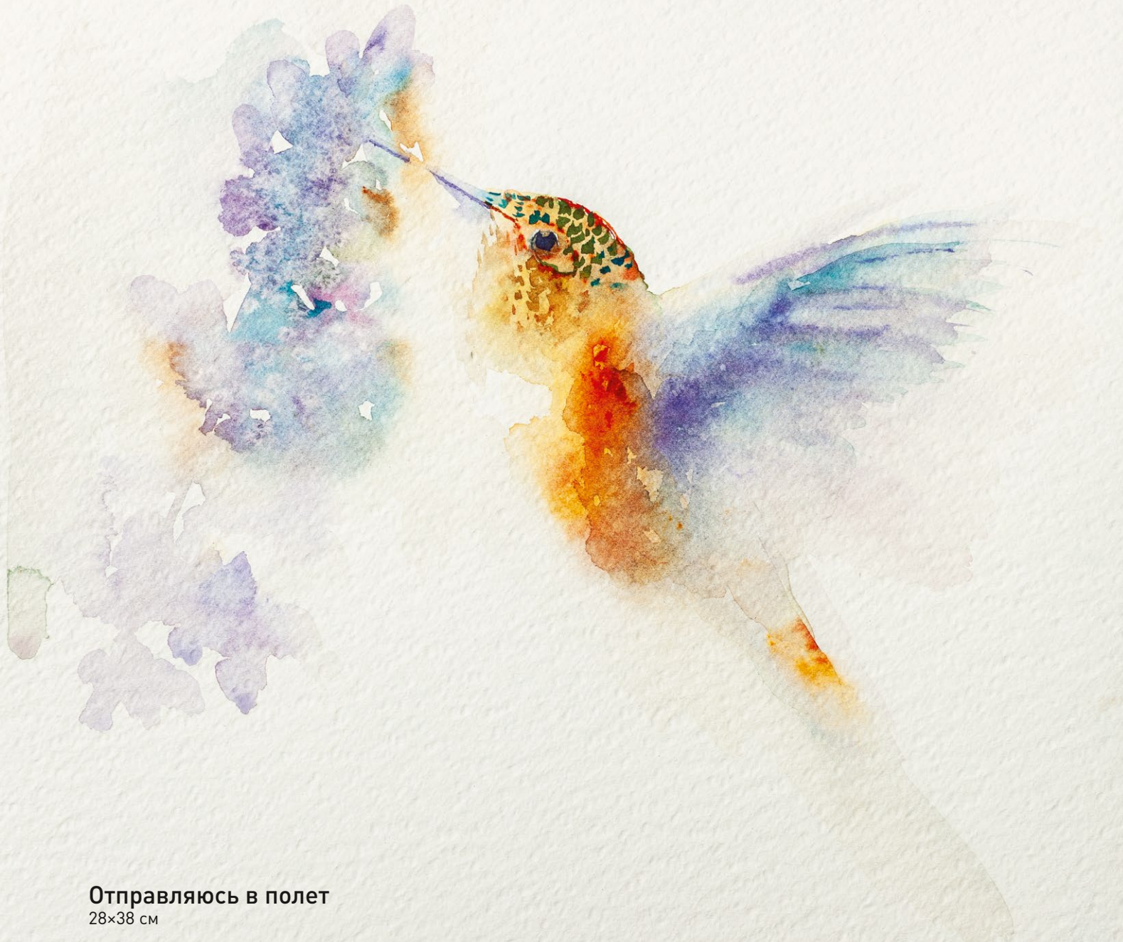
Отправляюсь в полет 28×38 см