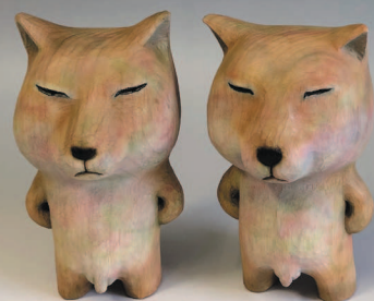
3-е и 4-е поколение