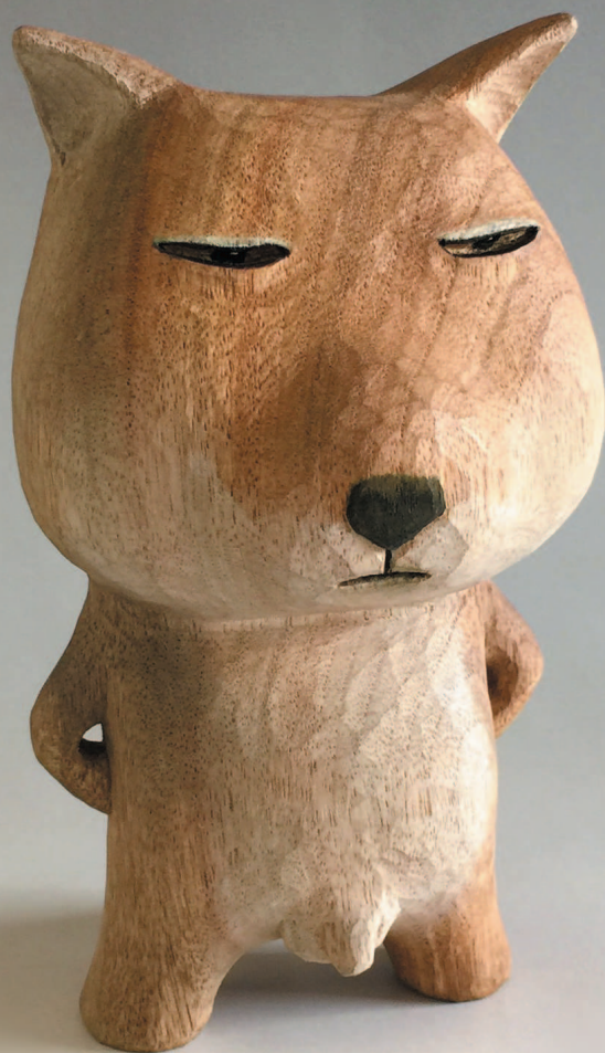
Тибетская лисица 1-го поколения