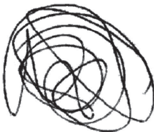
Рис. 1. «Каракули»

Келлог доказала, что рисунки двухлетних детей не являются бесцельным размазыванием красок и в них можно выделить 20 типов знаков. Точки, линии и кружки, начертанные детской рукой, отражают отдельные движения мышц, которые не контролируются