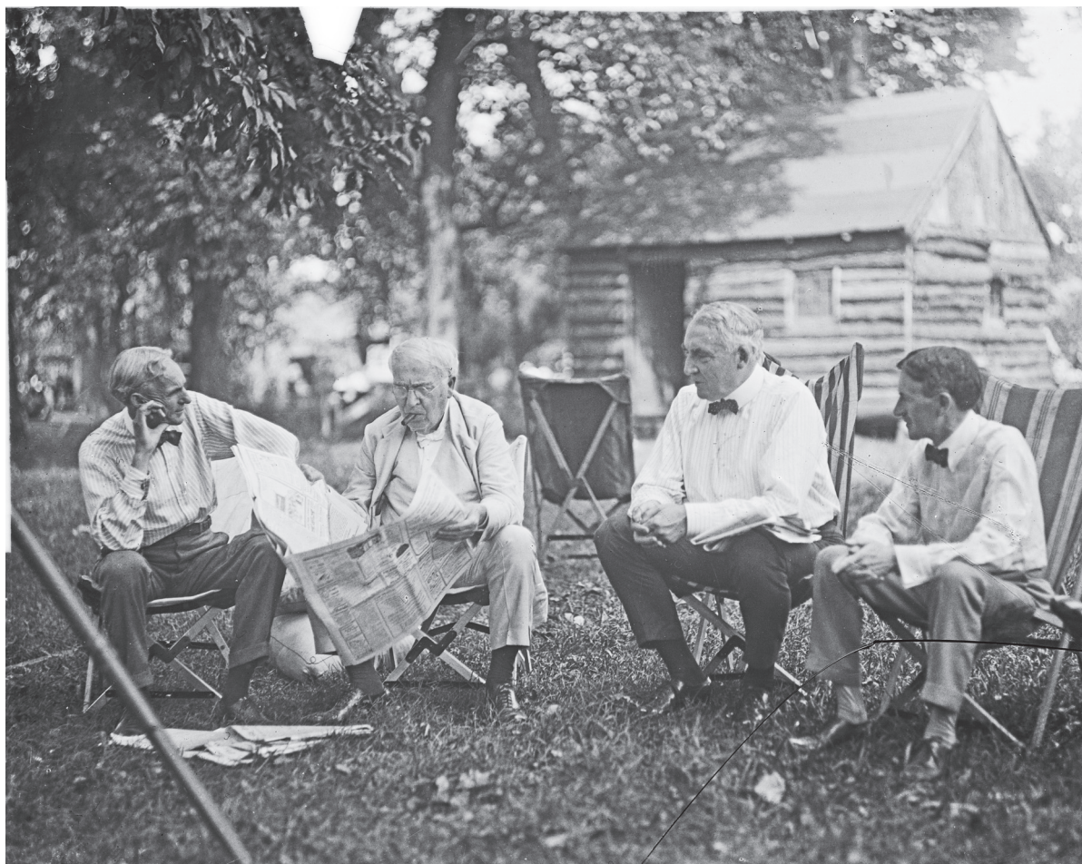
Генри Форд, Томас Эдисон, Уоррен Гардинг и Гарви Файрстоун — титаны автомобильной индустрии во время совместного отдыха в лагере в Пайквилле, Мэриленд.