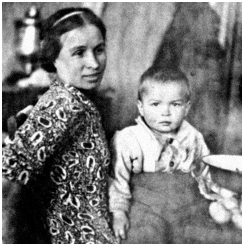
Рудольф Нуреев с матерью. 1941 г.

«Мать моя родилась в прекрасном древнем городе Казани. Мы мусульмане. Отец родился в небольшой деревушке около Уфы, столицы республики Башкирии. Таким образом, с обеих сторон наша родня — это татары и башкиры» (Рудольф Нуреев)