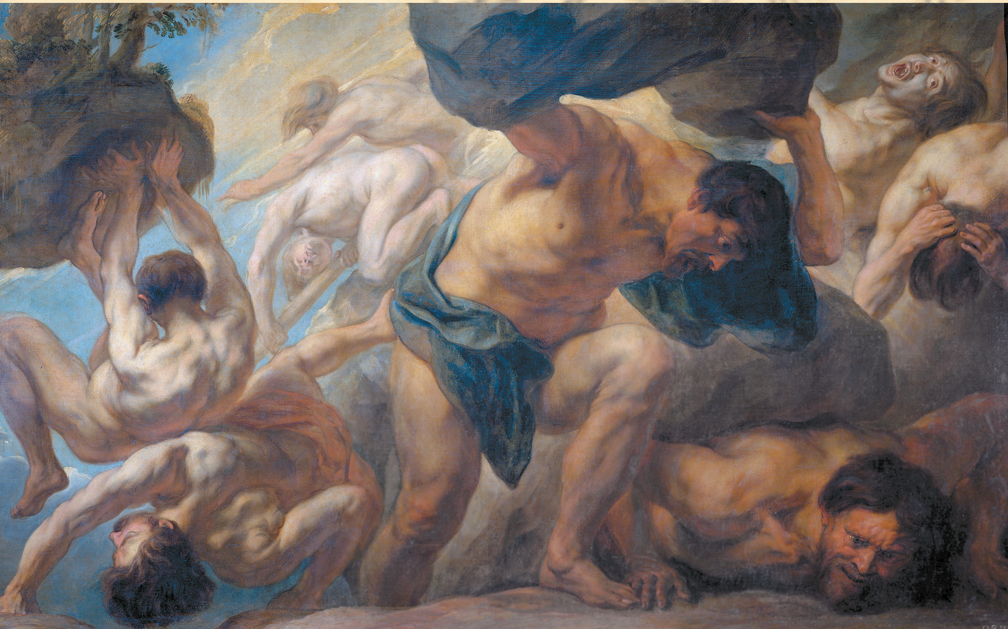
Питер Пауль Рубенс. Падение титанов