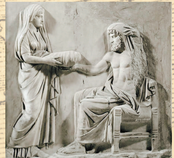
Рея приносит Кроносу завернутый в пеленки камень вместо новорожденного Зевса

На Крите с Зевсом произошла удивительная история. Пока няньки-нимфы перетаскивали его с места на место, он потерял свой пупок. И здесь налицо образность легенды. Потеря пупка, который связывал Зевса с чревом матери, означала разрыв поколений и времен. Именно на Крите как бы начинается но-