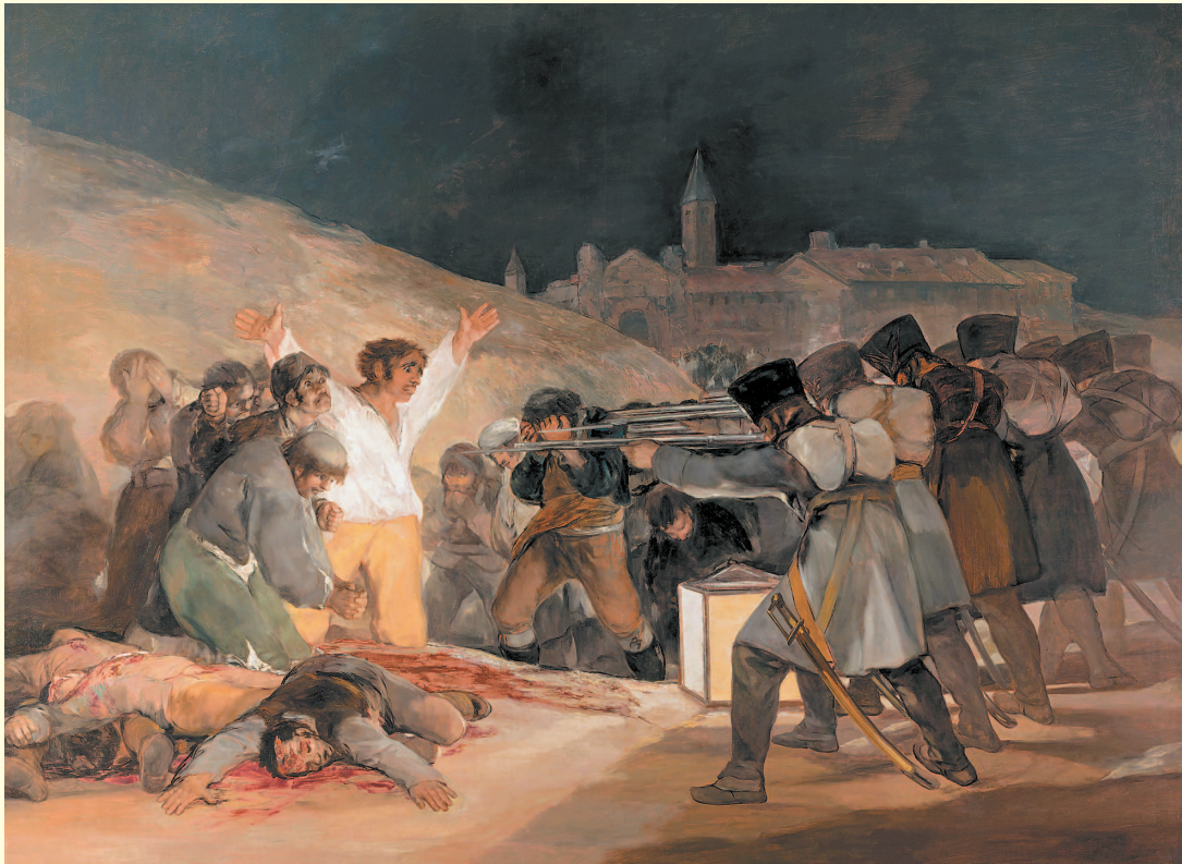
Франсиско Гойя. Расстрел повстанцев в ночь на 3 мая 1808 года

производят общечеловеческие ценности боли и радости. Чтобы миф соединился с историей, он должен много раз повторяться во времени, а этот миф, к сожалению, повторялся и повторяется постоянно. Всегда, когда мир накрывают войны, он начинает пожирать нас — своих детей, подобно Урану или Крону. Поистине, когда время войн и катаклизмов пожирает своих детей, это значит, что наступает хаос.