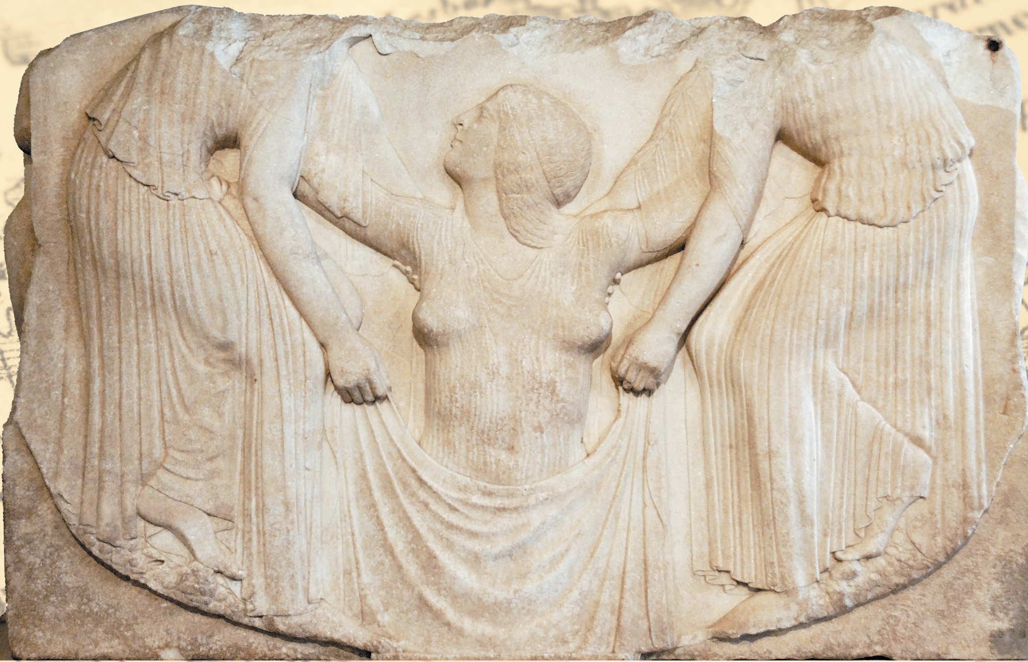
Рождение Афродиты на Троне Людовизи