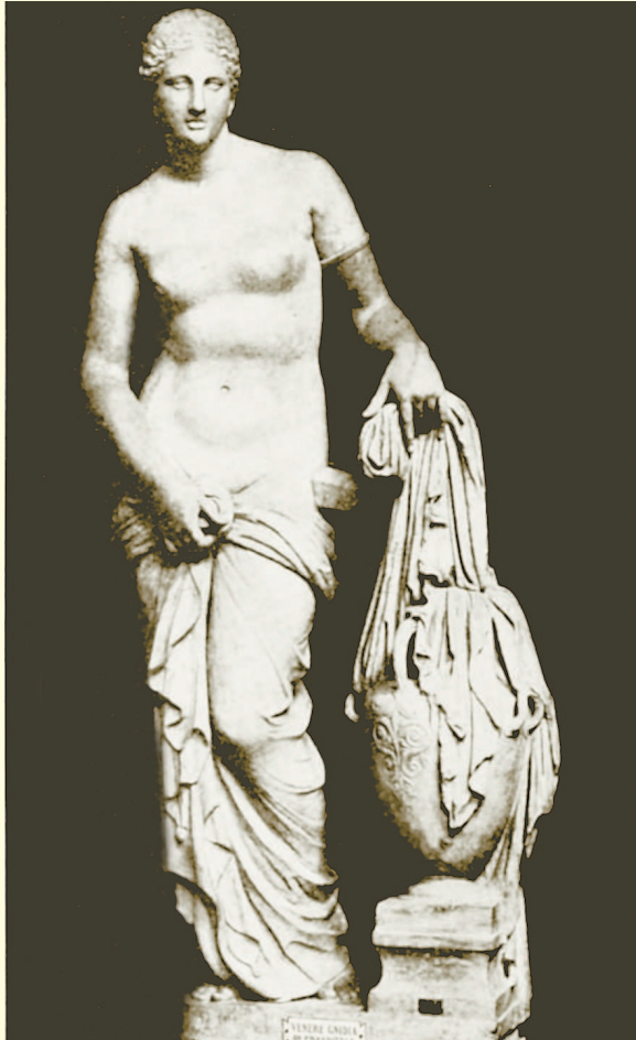
Пракситель. Афродита Книдская

Мы не знаем, когда именно произошли эти события. Они вне времени и вне бытия. Хочу обратить ваше внимание на образность мифа. Франсиско Гойя в картине «Уран, пожирающий своих детей» раскрыл современное, внятное нам содержание легенды. Широкими мазками написал художник нечто, теряющее сходство и связь с человекоподобием. Он запечатлел безумие уничтожения. Мифы вечно актуальны, потому что вос-