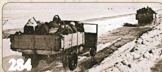
В кольце блокады