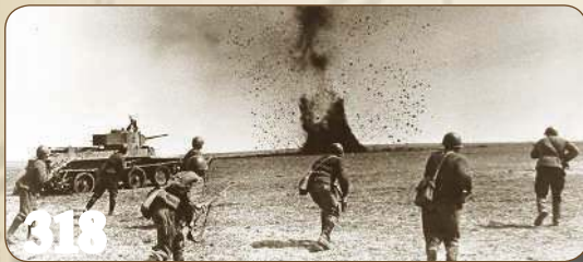
Красная армия наступает