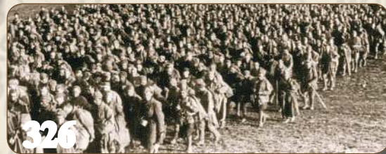
Летнее сражение за Ржев