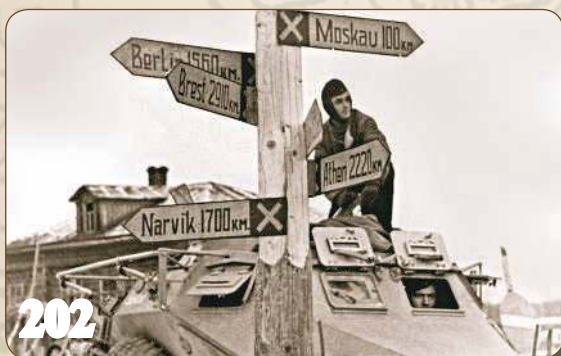
Москва на осадном положении