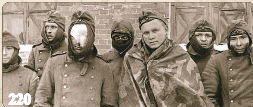
Итоги Битвы за Москву