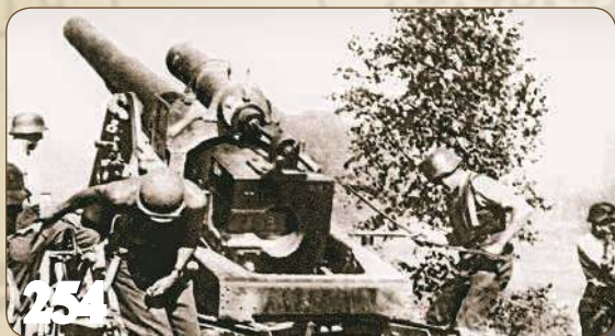
Катастрофа Крымского фронта