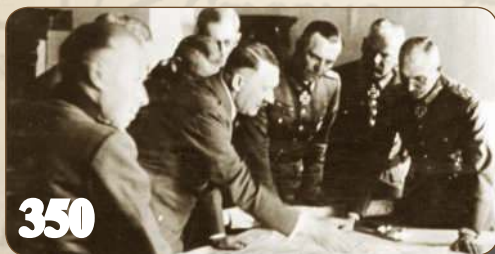
Приказ «Ни шагу назад!»