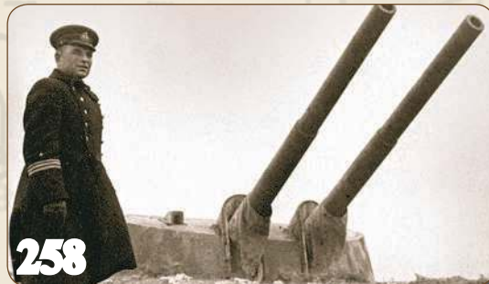
Второй штурм Севастополя