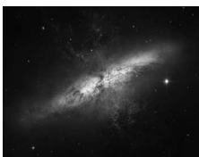
Галактика M82, в ней идет активное образование «новорожденных» звезд

Космос — поистине бескрайнее пространство. Вселенная и космические тела настолько огромны, что это может не укладываться в голове. Только представьте, в глубинах космического вакуума кружат планеты и звезды, по сравнению с которыми Земля — крошечная песчинка. Давайте вместе совершим космическое путешествие сквозь Вселенную к нашей планете. Вперед!