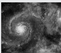
Спиральная галактика, расположенная на расстоянии множества световых лет от Земли

Звезды и планеты не летают в космосе сами по себе. Они вместе с космической пылью и газами образуют скопления, а те, в свою очередь, — галактики. Американский астрофизик Эдвин Хаббл (1889–1953) предложил разделить все галактики на группы.