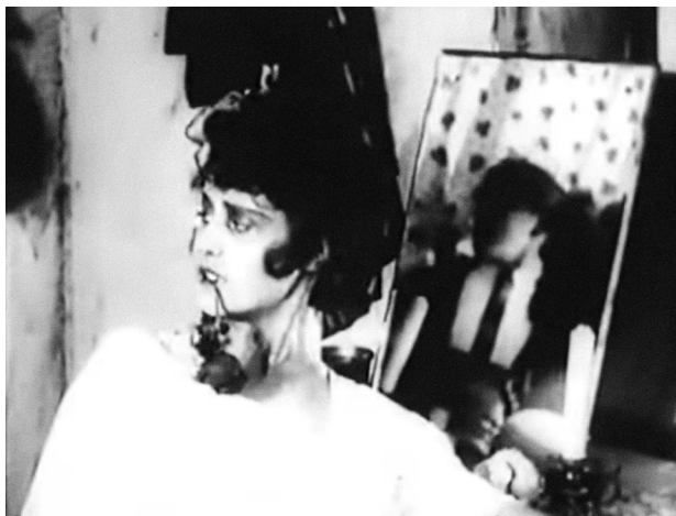
Вера Холодная в фильме «Последнее танго», 1918, реж. Вячеслав Висковский