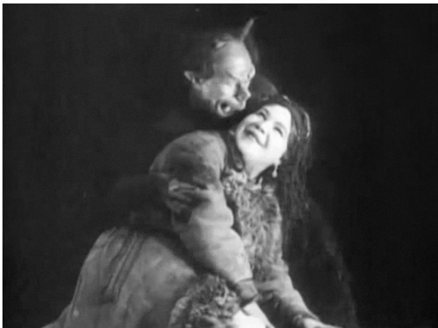
«Ночь перед Рождеством», 1913, реж. Владислав Старевич