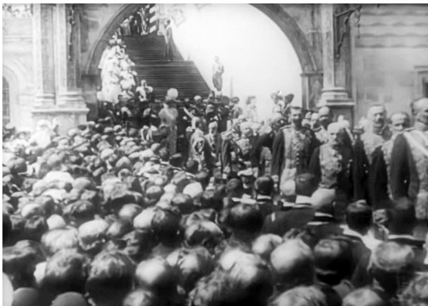
«Падение династии Романовых», 1927, реж. Эсфирь Шуб