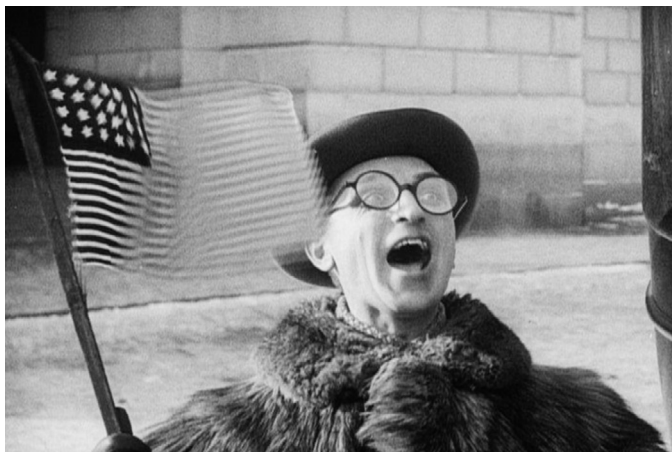
«Необычайные приключения мистера Веста в стране большевиков», 1924, реж. Лев Кулешов