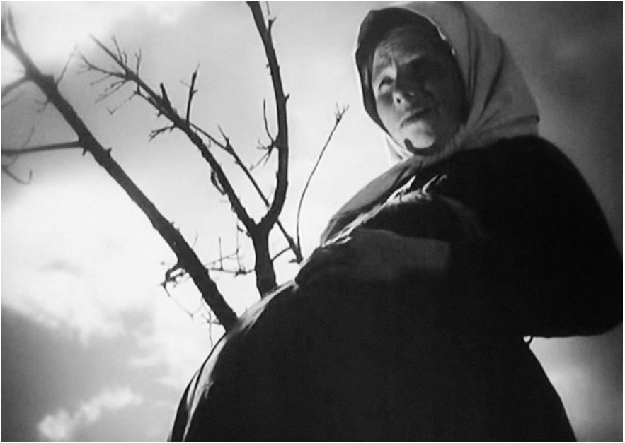
«Старое и новое», 1929, реж. Сергей Эйзенштейн, Григорий Александров