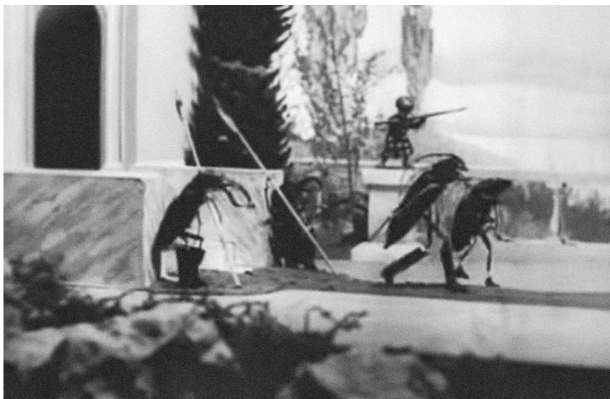
«Прекрасная Люканида, или Война усачей с рогачами», 1912, реж. Владислав Старевич