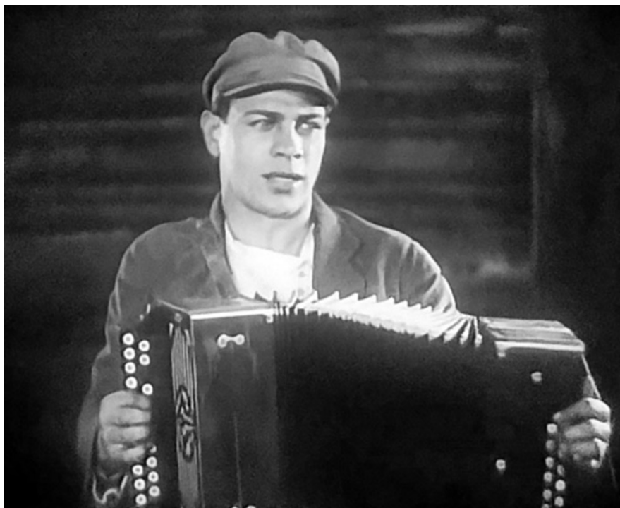
«Гармонь», 1934, реж. Игорь Савченко