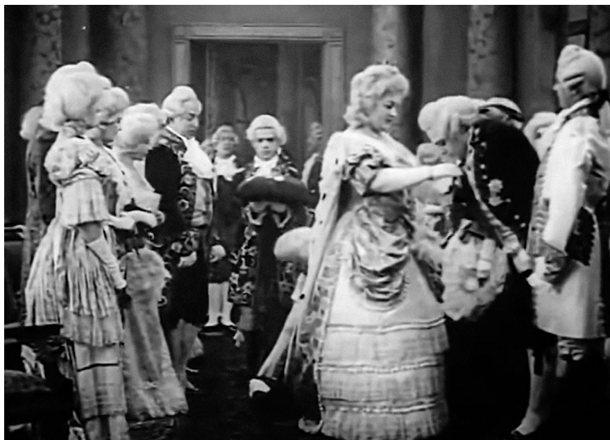
«Трехсотлетие царствования дома Романовых», 1913, реж. Александр Уральский, Николай Ларин