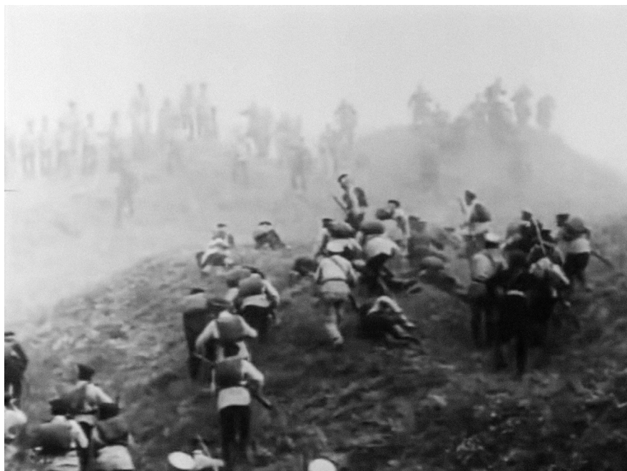
«Оборона Севастополя», 1911, реж. Василий Гончаров, Александр Ханжонков