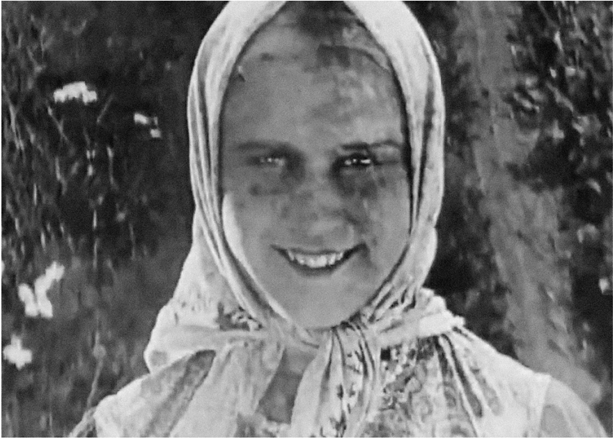
«Бабы рязанские», 1927, реж. Ольга Преображенская, Иван Правов