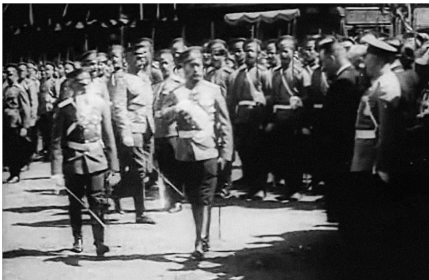
Коронация Николая II. Кинохроника, 1896, оп. Камилл Серф