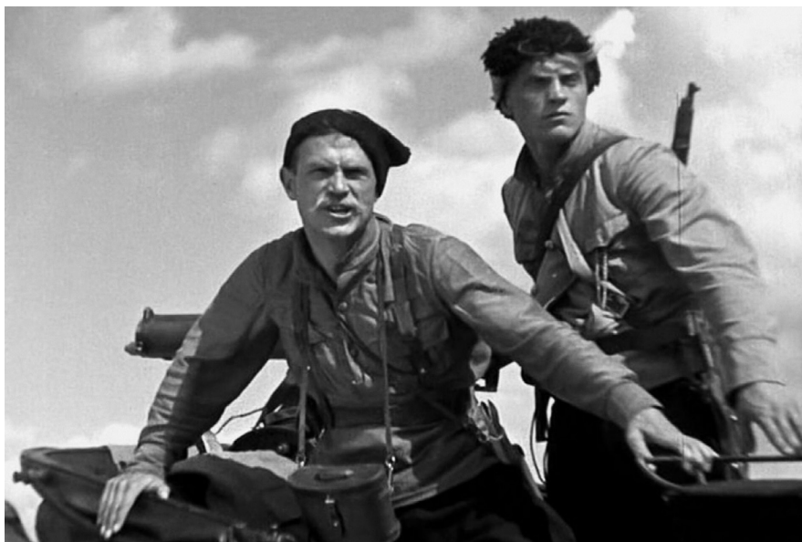
«Чапаев», 1934, реж. Георгий Васильев, Сергей Васильев