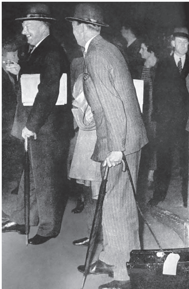
В начале августа 1939 года английская и французская военные миссии приехали в Москву для переговоров с Советским Союзом. На фотографии адмирал Реджинальд Дракс и генерал Жозеф Думенк

Они должны были согласиться. Это их инициатива — Пакт о ненападении. Мы не могли защищать Польшу, поскольку она не хотела с нами иметь дело. Ну и поскольку Польша не хочет, а война на носу, давайте нам хоть ту часть Польши, которая, мы считаем, безусловно принадлежит Советскому Союзу.