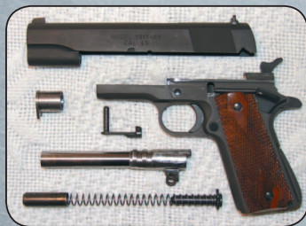
Основные детали (неполная разборка) пистолета M1911.

Пистолет M1911 состоял из трех крупных частей (рамки, ствола и кожуха-затвора) и 53 более мелких деталей. Автоматика работала за счет отдачи при коротком ходе ствола. Однако в отличие от всех предыдущих моделей ствол M1911 был соединен с рамкой пистолета при помощи только одной (качающейся) серьги, расположенной под казенной частью ствола. После выстрела ствол, сцепленный с затвором, двигался назад. При этом серьга поворачивалась на подствольной оси, и казенная часть ствола опускалась. Ствол останавливался, а затвор, продолжая движение назад, выбрасывал использованную гильзу, взводил курок и сжимал возвратную и боевую пружины. Кстати, конструктор нашел для этих пружин очень удачное месторасположение, разместив возвратную пружину под стволом, а боевую — в рукоятке, позади магазина.