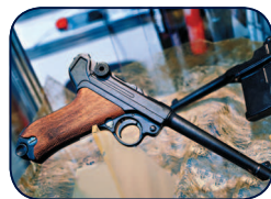
LP-08 — так называемая артиллерийская модель.

Артиллерийский «Парабеллум» имел общую длину 327 мм (длину ствола 200 мм), вес без патронов 1000 г и начальную скорость пули 370 м/с. Он предназначался для вооружения расчетов орудий и младших офицеров пулеметных команд. LP-08 с приставной кобурой-прикладом позволял вести прицельный огонь на расстояние до 800 м. Емкость магазина была стандартной — восемь патронов, но мог применяться и дисковый магазин системы Леера емкостью 32 патрона.