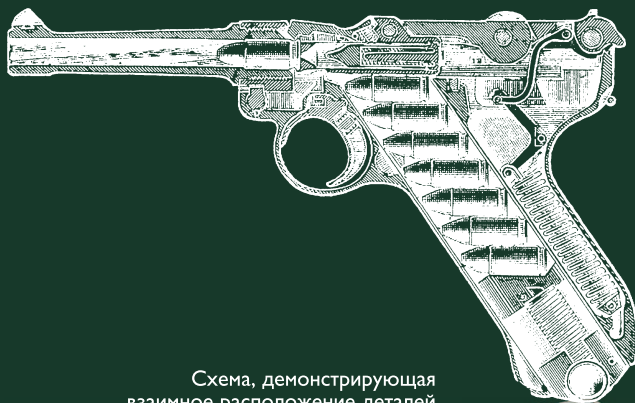
Схема, демонстрирующая взаимное расположение деталей пистолета Р-08 перед выстрелом.

Так как разработки Борхардта так и остались невостребованными, он вскоре возвращается на родину в Германию. Здесь он поступает на работу в фирму «Людвиг Лева и Компани» и приступает к разработке самозарядного пистолета. В ходе этой работы Борхардт знакомится с молодым австрийским инженером Георгом Люгером, который вскоре становится его главным помощником.