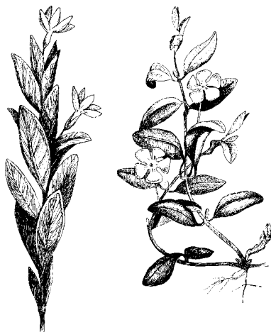
Барвинок прямой (справа) и малый

Две столовые ложки сбора трав с вечера положить в термос и залить двумя стаканами кипятка. Утром процедить, принимать по 100 г 4 раза в день.