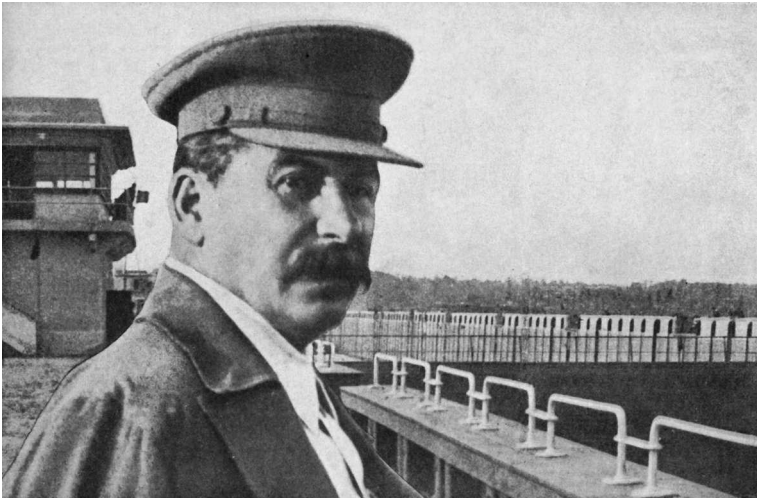
Иосиф Сталин на Перервинском шлюзе

Затем по вопросу о том, что темп развития сельского хозяйства у нас чрезмерно отстает от темпа развития ин-