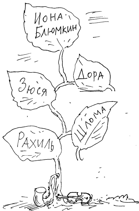
Древо Ионы Блумкина