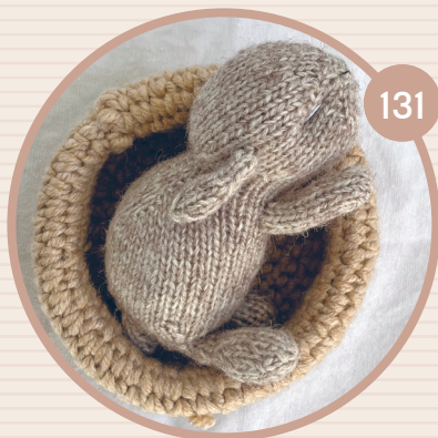
СПЯЩИЙ ЗАЙЧОНОК БЕННИ