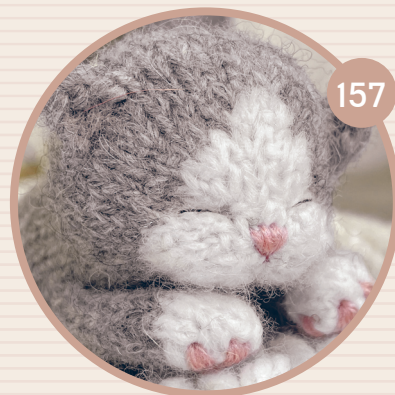
СПЯЩИЙ КОТЕНОК СПУН