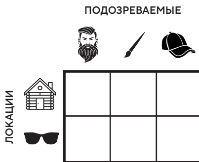
СХЕМА ДЛЯ ЗАПОЛНЕНИЯ И ОБДУМЫВАНИЯ