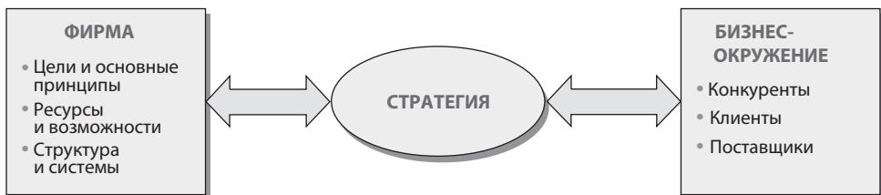
Рис. 1.2. Основная схема: стратегия как связь между фирмой и бизнес-окружением (рынком)

Представление о стратегии как связующем звене между фирмой и ее бизнес-окружением сходно с широко используемым, хотя и уступающим этому взгляду методом SWOT-анализа. Однако, как объясняется во вставке 1.3, двунаправленная схема учета внутренних и внешних факторов, влияющих на состояние дел в компании, предпочтительнее SWOT-схемы, где взаимодействие рассматривается по четырем направлениям.