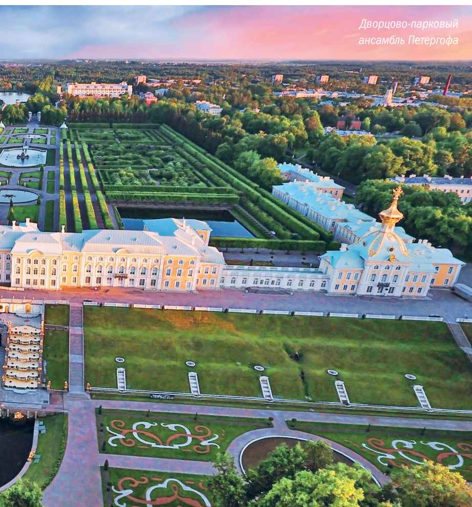
Дворцово-парковый ансамбль Петергофа

Восстановительные работы начались сразу после освобождения города, весной 1944-го, и уже летом 1946 года состоялось торжественное открытие парка и первых возрожденных фонтанов. В последующие годы постепенно открывались