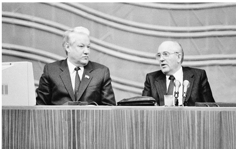
Президенты РФ Борис Ельцин и СССР Михаил Горбачев. Октябрь 1991

зацией, «наведением порядка», «укреплением вертикали» исполнительной власти, возвращением «сильного государства» и ростом международного авторитета России».