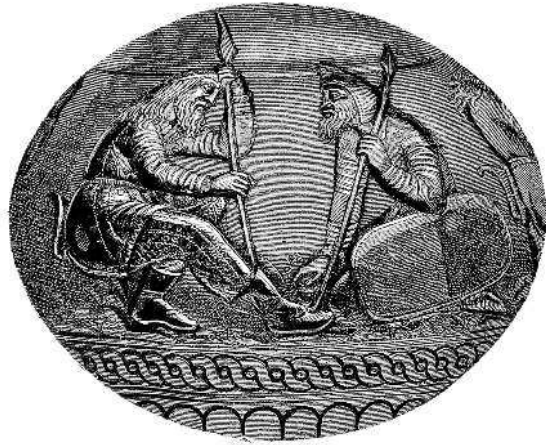
Сцена из жизни скифов на Куль-Обской вазе: совещание воинов.

вами своих предков, и славный единокровец их, философ Анахарсис, ученик Солонов, напрасно хотел дать им законы афинские, был жертвою сего несчастного опыта. В надежде на свою храбрость и многочисленность, они не боялись никакого врага, пили кровь убитых неприятелей, выделанную кожу их употребляли вместо одежды, а черепы вместо сосудов, и в образе меча поклонялись богу войны, как главе других мнимых богов.