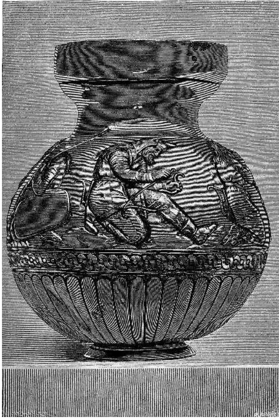
Куль-Обская ваза с изображениями скифов, хранящаяся в Эрмитаже. На стороне, обращенной к зрителю, изображен воин, натягивающий тетиву на лук.