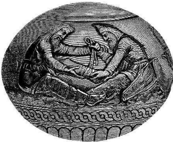
Сцена из жизни скифов на Куль-Обской вазе: перевязывание раны на ноге.