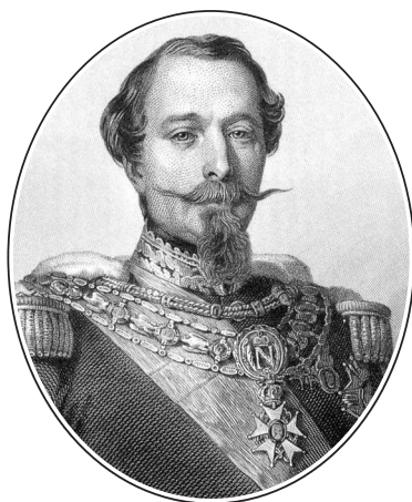
Первый президент Франции, единственный президент Второй республики (1848–1852), император французов (1852–1870) Наполеон III (1808–1873)

успокоился. Хребет революции сломен, но, конечно, и Кавеньяк, и избранный 10 декабря 1848 г. президентом принц Луи-Наполеон Бонапарт и не подумают бороться с ним, всемогущим борцом против революции, бдительным стражем порядка! Пришло и 2 декабря 1851 г., встреченное с восхищением в Зимнем дворце. Ночной налет, покончивший со Второй республикой, молодецкий расстрел генералом Сент-Арно безоружной толпы зрителей на Больших бульварах — все это очень понравилось царю. И хотя дальше последовали некоторые неприятности и принц-президент предпочел