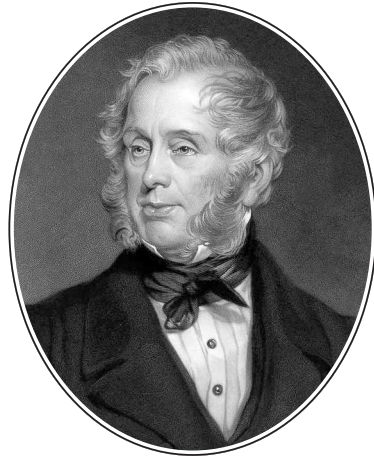
Премьер-министр Великобритании Генри Джон Темпл, 3-й виконт Пальмерстон (1784–1865)

целостности Турции, союзники напали на Одессу, Севастополь, Свеаборг и Кронштадт, на Колу, Соловки, на Петропавловск-на-Камчатке, а турки вторглись в Грузию. Британский кабинет уже строил и подробно разрабатывал планы отторжения от России Крыма, Бессарабии, Кавказа, Финляндии, Польши, Литвы, Эстонии, Курляндии, Лифляндии. Вдохновитель всех этих планов, «воевода Пальмерстон», иронически воспетый в русской песенке, «в воинственном азарте... поражает Русь на карте указательным перстом», а его французские союзники уже начинают сильно беспокоиться, наблюдая рост аппетита увлекающегося милорда.