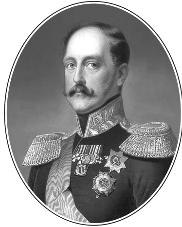
Император и самодержец всероссийский Николай I Павлович (1796–1855)

Присоединение в том или ином виде к Российской империи Сербии, Болгарии, Молдавии, Валахии, Галлиполи с Константинополем грозило Австрии обхватом русскими силами с востока, с севера, с юго-востока и с юга и потерей политической самостоятельности. Мало того, славянские народы самой Австрии — чехи, словаки, хорваты, русины, поляки — не могли бы остаться покорными верноподданными Габсбургского дома при таких переменах, и Австрийской империи грозил бы распад. Меттерних всегда этого боялся, его преемник Шварценберг — также, преемник Шварценберга по управлению министерством иностранных дел — тоже.