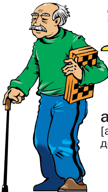
abuelo m [абуэ́ло] дедушка