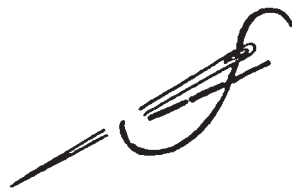
Шов «назад иголку» (рис. 3).