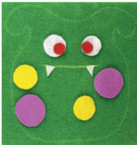
Фото 1. Маленький Монстрик

Чтоб вывернуть детали, можно применить китайскую палочку, карандаш.