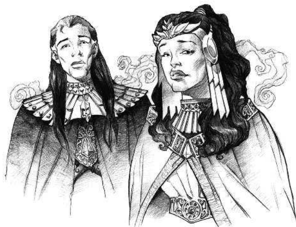
Гэв и Джори Дарагон

Как и многие первооткрыватели, контрабандисты и колонисты, Гэв и Джори были не очень образованными людьми. Еще в детстве они поняли, что наделены Силой, но ни у одного из них не хватило терпения на продолжительные, кропотливые тренировки, необходимые для того, чтобы стать джедаями. Вместо этого они полагались на свою «удачу» и на слепую веру в то, что сумеют избежать столкновения со звездами и черными дырами. Не вылезая из долгов, они продолжали надеяться на открытие новой трассы и щедрую награду Братства Навигаторов.