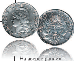
1 песо, 1881 г.

На аверсе ранних аргентинских монет чаще всего изображалась женщина во фригийском колпаке (символ свободы), на реверсе — герб или указание номинала.