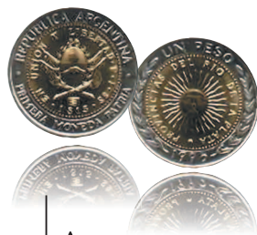
1 песо, 1995 г.

Аверс монеты — копия первых аргентинских монет 1813 г., на реверсе изображено «Майское солнце», символ Аргентины.