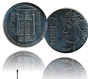
2 песо, 2010 г.

На аверсе монеты изображены двери в здании по адресу «ул. Реконкисты, 266». На реверсе — часть официального логотипа и номинал.