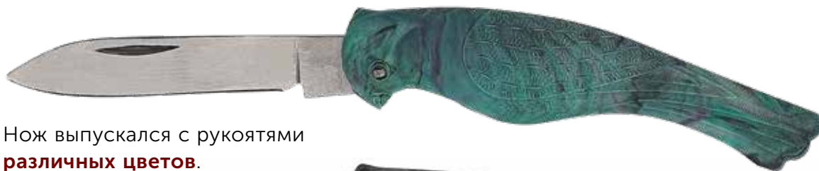
Нож выпускался с рукоятками различных цветов.

Есть мнения, что на рукоятках ножей данной серии так же, как и на предыдущем ноже «Попугай», изображен соловей, но в среде коллекционеров данный нож известен именно под устойчивым названием «Попугайчик».