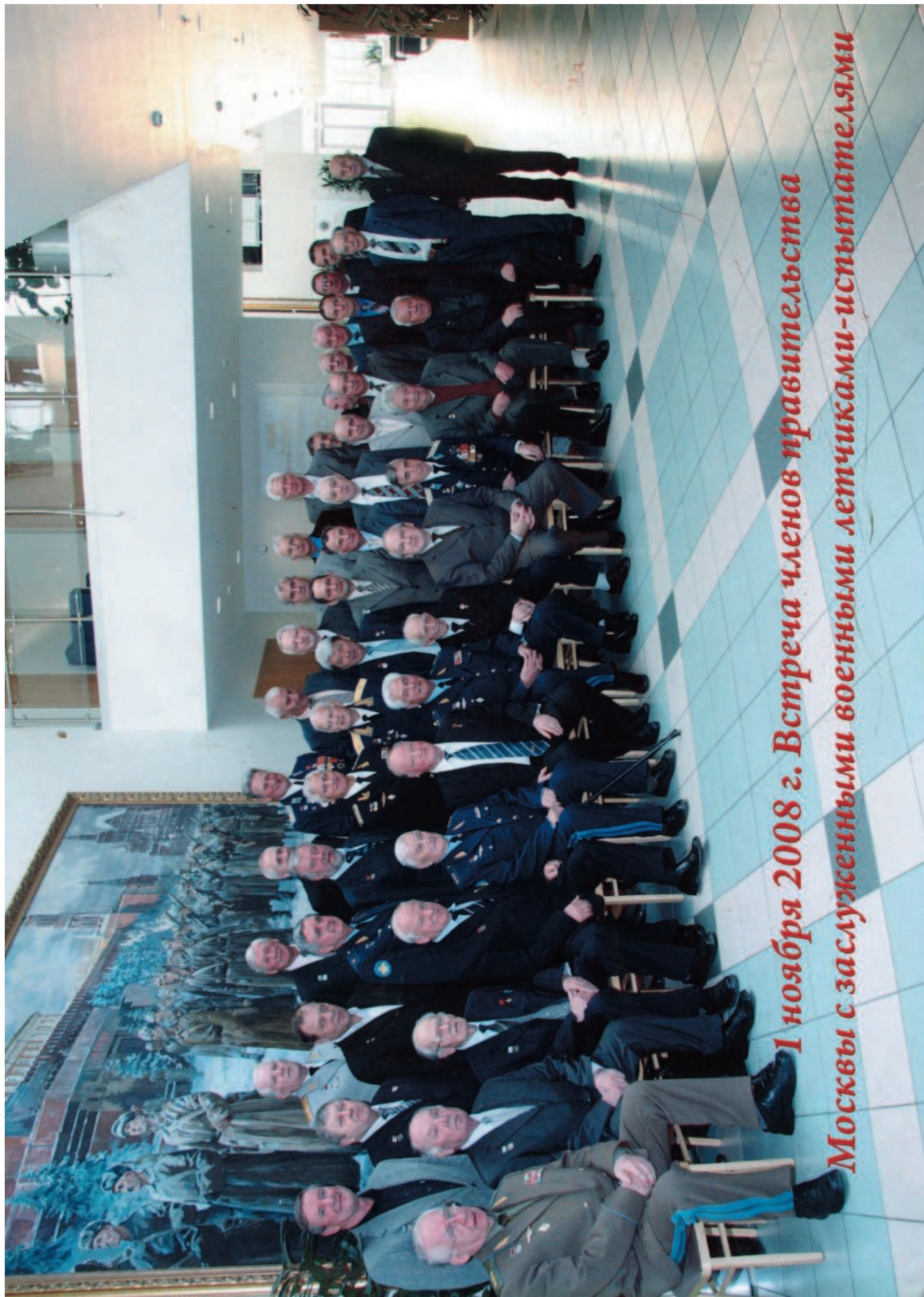
1 ноября 2008 г. Встреча членов правительств Москвы с заслуженными военными летчиками-испытателями