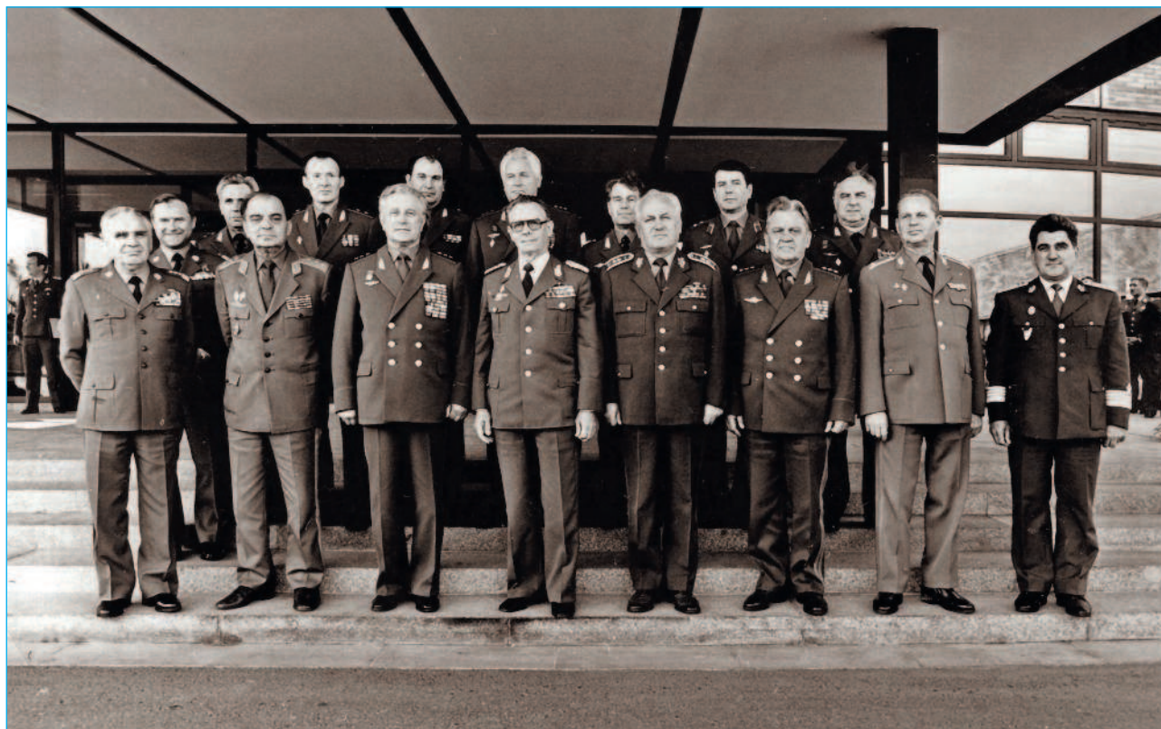
Командующие ВВС и ПВО стран Варшавского договора

Преданный летному делу, он всегда демонстрировал отменную летную подготовку, принимая участие в испытаниях сверхзвуковых истребителей-перехватчиков.