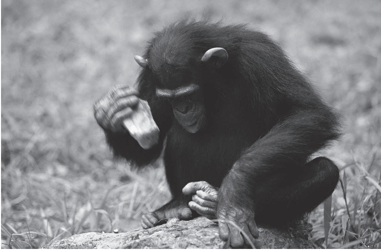
Рисунок 1.2. Шимпанзе ( Pan troglodytes ) в Габоне использует инструменты, чтобы вскрывать орехи

выдр и слонов), — некоторые птицы (вороны и попугаи) и даже беспозвоночные (головоногие) выработали в процессе эволюции рудиментарное умение пользоваться орудиями (Hansell 2005; Sanz, Call and Boesch 2014; рис. 1.2), только гоминины сделали изготовление орудий отличительной чертой своего поведения.