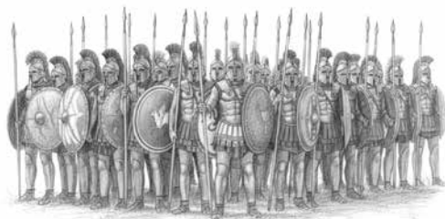
Рис. 1. Греческая пехота

С IV же века нашей эры первенство перехватила конница, поскольку резкий рост её мощи сломал сложившийся баланс. Теория господства конницы стоит на двух столпах: первый — это гипотеза Чарльза Омана о том, что после битвы при Адрианополе 378 года на полях сражений воцарилась тяжёлая кавалерия вплоть до сражения при Мариньяно 1515 года. Второй подпоркой прикрутили идею Линна Уайта, что не-