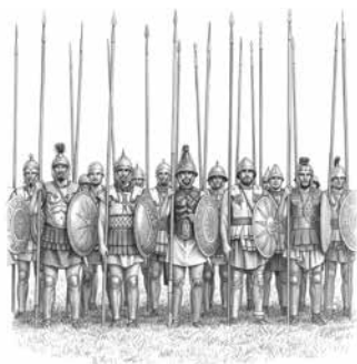
Рис. 2. Македонская фаланга