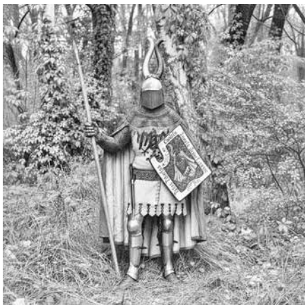
Рис. 5. Рыцарь XIV века

В этом коротком отрывке сконцентрированы все основные столпы теории периодизации: физический таран лошадью как основной способ атаки против пехоты. В отсутствие детальных исследований столкновение армий рассматривалось через призму увиденного в фильмах и играх: если у воинов в руках оружие ближнего боя, значит, исход сражения определяется физическим столкновением. Далее включается современная логика, где основа доминирования — это превосходство оружия, которым и стал конь или «дестриэ». Сам по себе термин destrier (это не порода, а скорее набор качеств) вполне аутентичен и действительно подра-