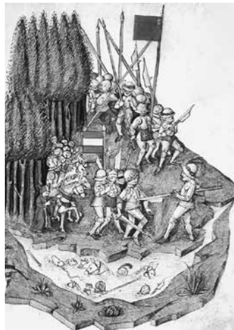
Рис. 7. Битва при Моргартене. Миниатюра из хроники Бенедикта Чахтлана, 1315