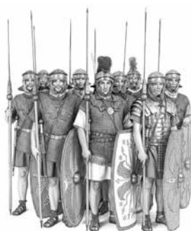
Рис. 3. Римская пехота

бывалый успех тяжёлой рыцарской конницы является следствием распространения стремян в Европе с VIII века и, соответственно, появления таранного удара (о нём чуть ниже). Естественно, и гипотеза Линна Уайта, и концепция Чарльза Омана на Западе уже подверглись обширной критике и существенно пересмотрены, но поскольку на русский язык всё это не переводилось, то мы по сей день живём теориями середины прошлого века.