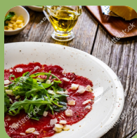
Карпаччо из печеной свеклы