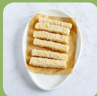
Хрустящие палочки моцареллы