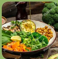
Боул с нутом, авокадо, брокколи, грибами и тыквой