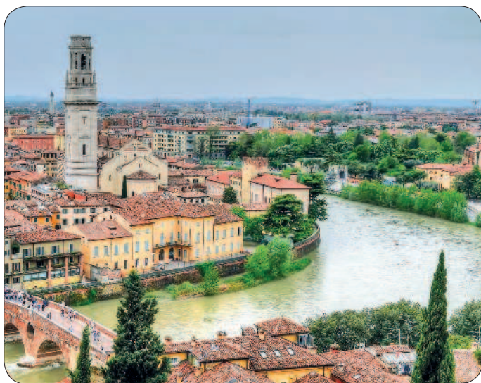
Верона, панорама города