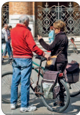
На улицах города Палладио