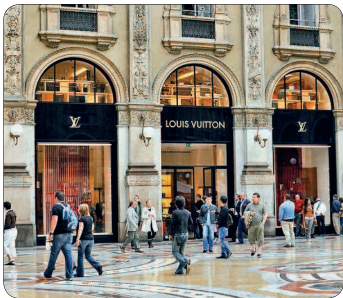
На улицах «Золотого четырехугольника»