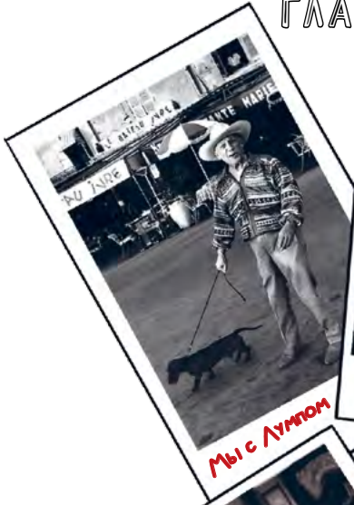
Мы с Лупом