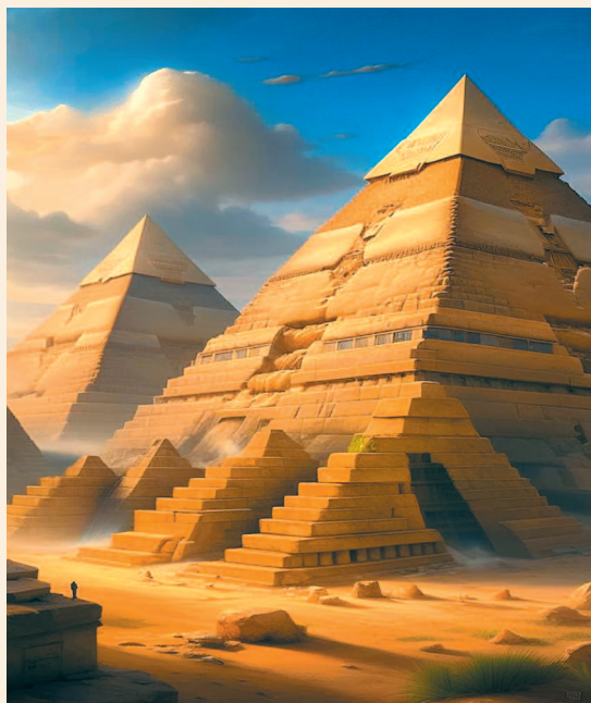
Легенда гласит, что Таро родом из Древнего Египта

Откуда Поль Христиан брал информацию? Он работал в библиотеке при министерстве народного просвещения Франции. Благодаря Наполеону и его Египетскому походу