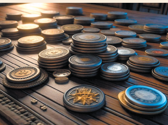
Первые карты Таро выглядели как медали с выбитыми на них картинками и цифрами