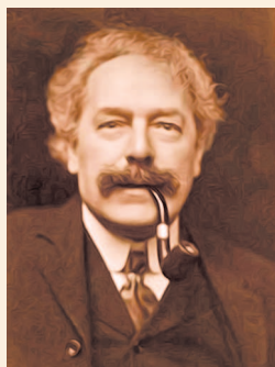
Артур Эдвард Уэйт

авторство колоды «Таро Магов», которая считается образцовой по своему исполнению и глубине символизма. Арканами Вирта иллюстрировали книги по Таро многие авторы XX века.