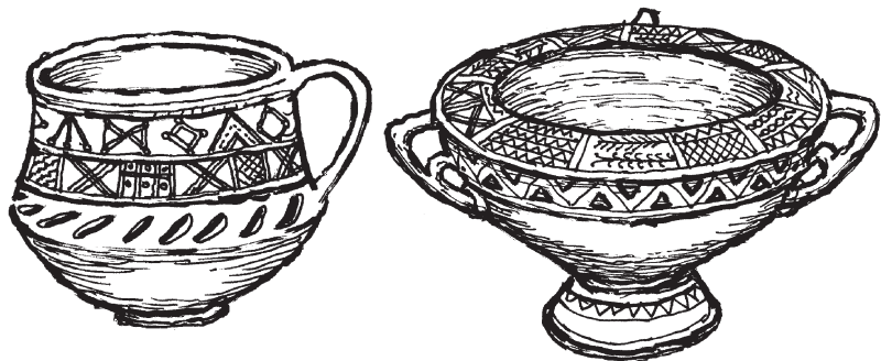
Гадательные чары (чаши)

В Древней Руси определение человека как «чародей» говорило само за себя. Чародей — это такой жрец, который действовал с чарой (чашей), он гадал