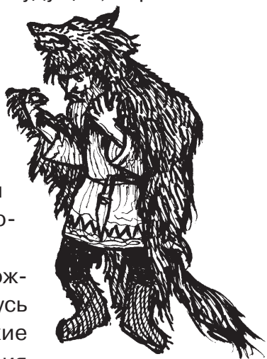
Волхв в волчьей шкуре

Но вот наступил 988 год от Рождества Христова, и в Киевскую Русь пришло христианство. Языческие идолы и волхвы после крещения Руси подверглись жестокому гоне-