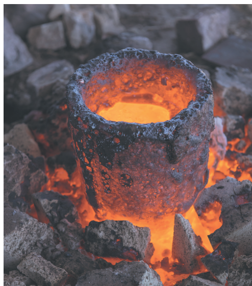
Тигель с расплавленной железной рудой

Около 5000 лет назад человек научился выплавлять и обрабатывать металл и начал изготавливать орудия из меди и бронзы — сплава меди и олова в пропорциях от 95 : 5 до 80 : 20. Сложно сказать, что появилось первым — бронзовые мечи или ножи. Хотя, безусловно, ножи были более просты в изготовлении. Уже в позднем бронзовом веке (1300–1100 гг. до н. э.) стало известно