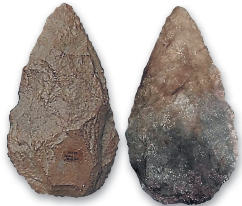
Этим заостренным камням, найденным в Сьерра-де-Атапуэрка, более миллиона лет

орудие обычно соответствовало размеру кисти и не имело рукояти.