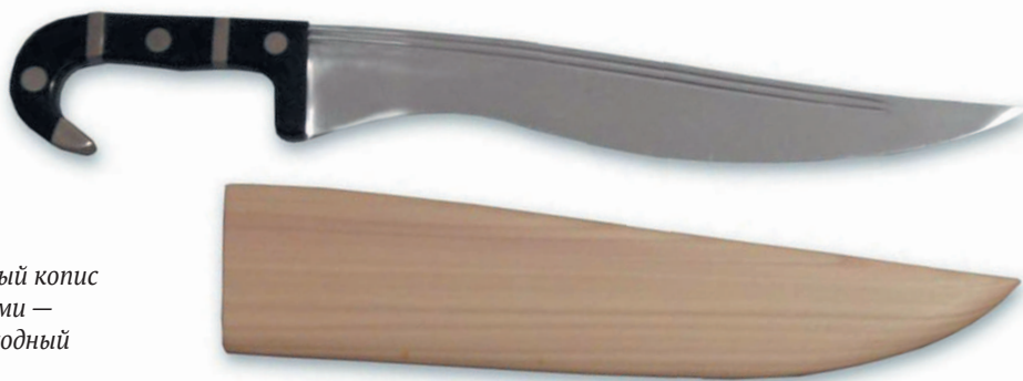
Небольшой современный копис с деревянными ножнами — удобный бытовой, походный и даже кухонный нож