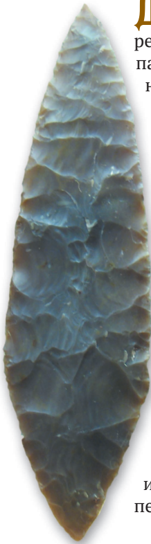
Кремень и обсидиан — первые материалы для изготовления ножей

Для защиты и нападения первобытный человек использовал ветки деревьев, камни и многое другое, что попадалось под руку. Однако эти умения не делали его homo sapiens — человеком разумным. До той поры, пока люди научатся изготавливать орудия труда и целенаправленно их применять, пройдет немало времени.