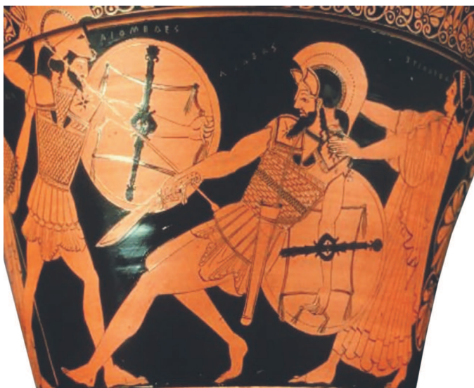
Сражение двух гоплитов: воин в центре вооружен кописом. Изображение на древнегреческой вазе

Называвшийся в древности также «махайра» (в современном греческом языке это слово означает «нож»), kopis с греческого переводится как «рубить, отсекающий». Основным оружием древних