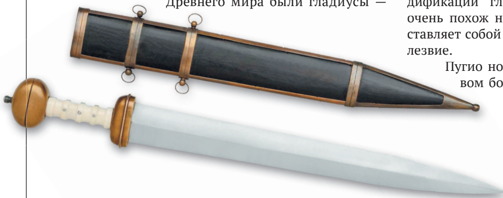
Меч гладиус — прототип кинжала пугио

Пугио носили чаще всего на левом боку, гладиусы — на пра-