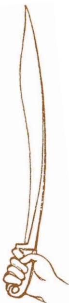
Копис с крюкоподобной рукояткой

Мечи кописы для ценителей холодного оружия интересны в первую очередь тем, что они стали прототипами мачете. Один из ведущих современных производителей ножевой продукции американская фирма Cold Steel выпускает несколько длинноклинковых ножей под обозначением Cold Steel Kopis Machete .