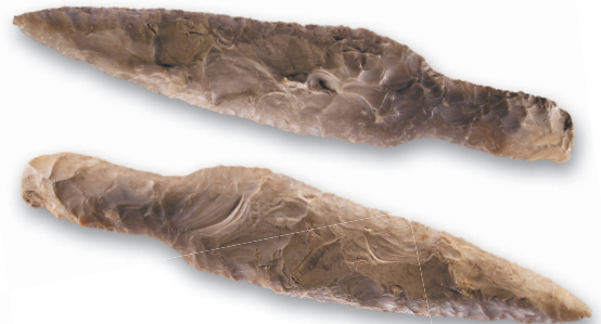
Рукояти каменных ножей обычно вытесывали как продолжение клинков

Конструкция ножей в течение нескольких последних веков изменилась