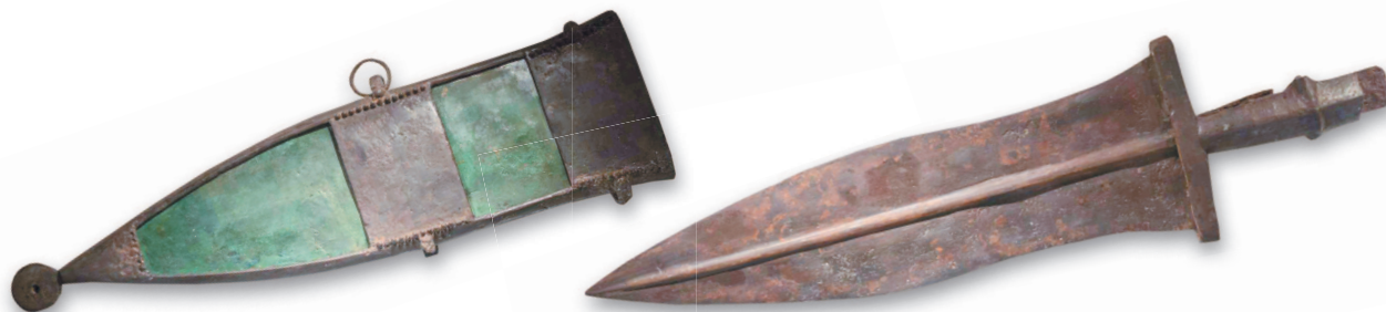
Классическая форма пугио — «песочные часы» с сужением в «талии». На фото представлен пугио, являющийся экспонатом музея римского форта Сегедунум в городе Уолсенд, Великобритания

вом, поэтому именно кинжалы, а не мечи быстрее можно выхватить правой (основной действующей) рукой. Кроме того, из-за тесноты манипулярного построения 45-сантиметровый гладиус извлекать из ножен было неудобно, чего не скажешь о 25-сантиметровом пугио. Таким образом, становится очевидным, что пугио в тактике боя придавали особое значение. Если израсходованы пилумы (легкие метательные копья), поломалась гаста (длинное копье с толстым древком) и затупился гладиус, в ход шли пугио.