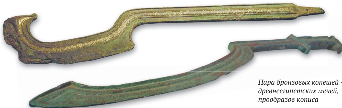
Пара бронзовых копешей — древнеегипетских мечей, прообразов кописа

увеличивается энергия удара. Изогнутый клинок кописа врезается в цель с гораздо большей силой, чем развивает рука. По свидетельству римлян, испытавших это оружие на себе, ни один шлем, даже самый прочный, не выдерживал удара кописом.