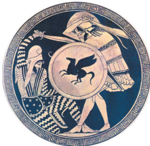
Дуэль персидского (повержен на землю) и греческого воинов. Первый вооружен изогнутым мечом, второй — кописом

Некоторые специалисты предполагают, что копис послужил прототипом для непальских ножей кукри. Действительно, оба образца холодного оружия имеют схожую серповидную форму. Однако, как известно, Александр Великий со своей конницей, вооруженной кописами, до Непала не дошел, застряв в Индии, и вернулся после в Вавилон. Кукри, как и копис, скорее всего, происходит от обычных сельскохозяйственных серпов — общепотребимых орудий, появившихся независимо во многих уголках света.