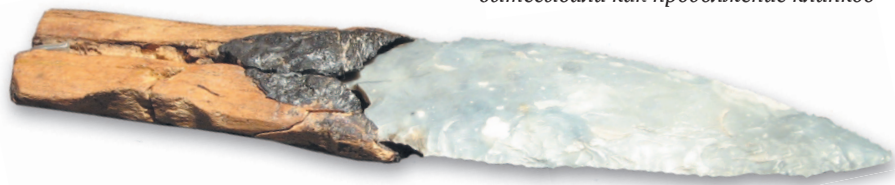
Древний прообраз современного ножа — часть расщепленной ветки дерева с вставленным и закрепленным смолой и сухожильными нитями каменным клинком, предварительно обработанным и заостренным

Древнейшие инструменты, которые условно можно именовать ножами, изготавливали из камня и кости. В период палеолита люди использовали для этого кремень, кварц, кварцит и песчаник. Методичными ударами человек откалывал от кремневой глыбы большие обломки, а затем обтесывал их с двух сторон, придавая треугольную или миндалевидную форму. В длину