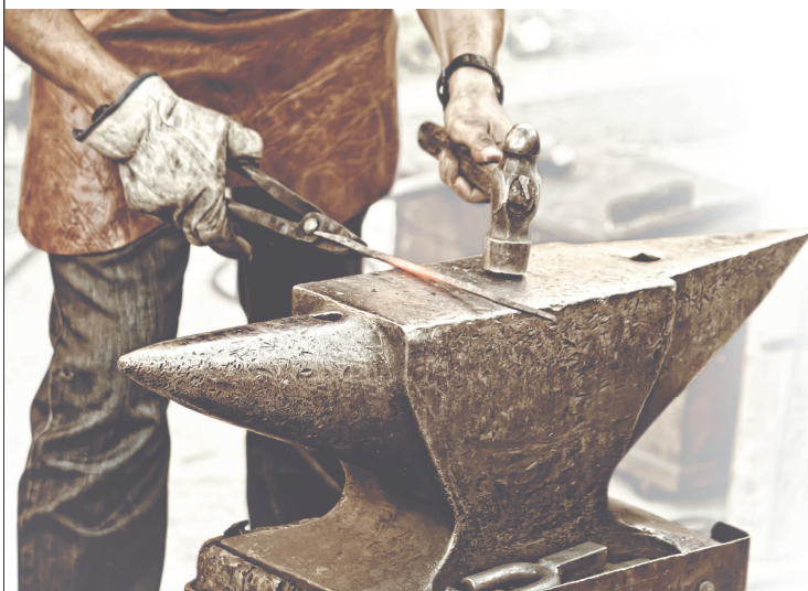
Несколько тысячелетий труд кузнеца приравнивался к божьему промыслу, а самого мастера почитали наравне со священником

До нас дошли многие уникальные образцы ножевого искусства. Одни появились много веков назад и существуют исключительно как музейные экспонаты, вторые, не менее древние, выпускаются сегодня практически в неизменном виде, а третьи появились в XX в. и отличаются непревзойденным качеством, их производят массово промышленным способом.