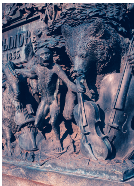
Звери в основании памятника

Когда смотришь на бронзовый зверинец, устроившийся в ногах у писателя, поражаешься его реалистичности. Удивительно, но скульптор принял сложное решение создавать всех героев басен Крылова с натуры, и на эту работу у него ушло почти пять лет. Многие животные жили прямо в доме скульптора. Так, например, за ручным волком, лисой, медведем и ослом ухаживали дети